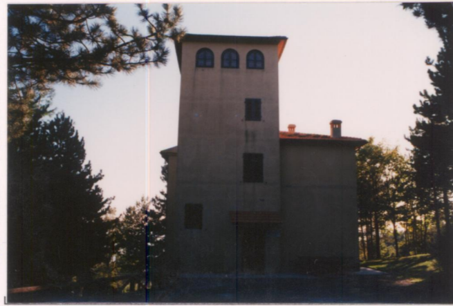
p.v. N. 2. Retro - Lato nord.....