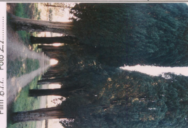
Film 6.7.7. Foto 27