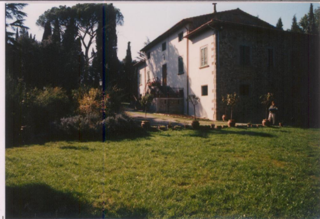
Film 6.7.7. Foto 31