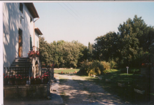
Film 6.7.7. Foto 30