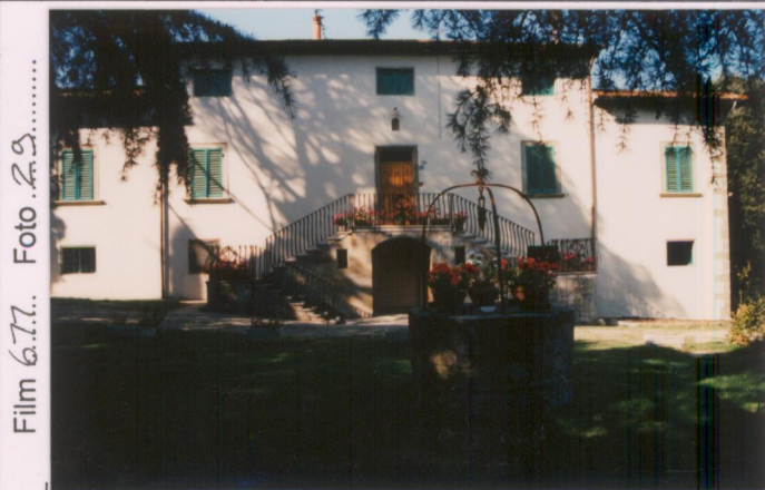
Film 6.7.7. Foto 29