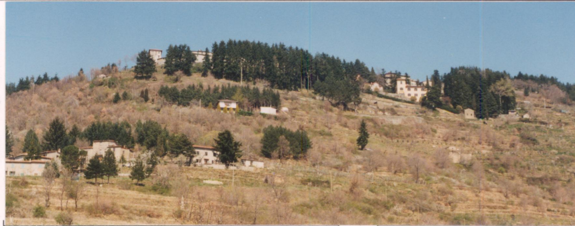
p.v. N. 1... Veduta da Casale