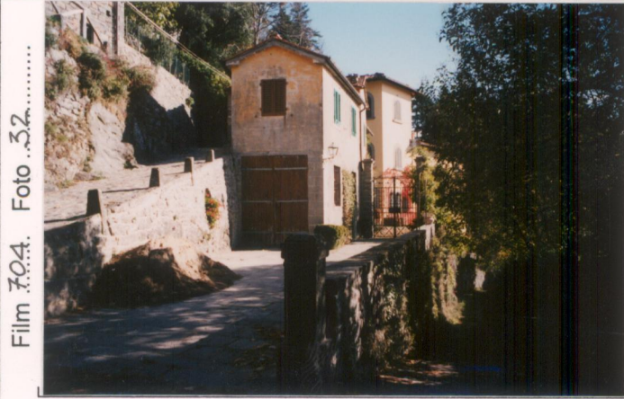
p.v. N. 4. Ingresso