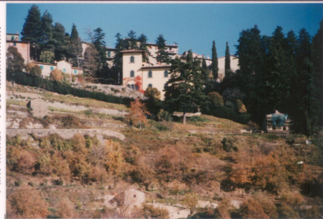
p.v. N. 2... I. dem