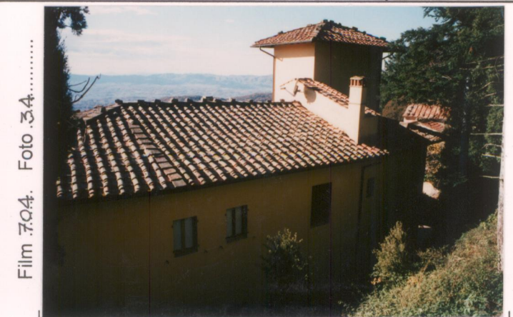
p.v. N. 7. Retro