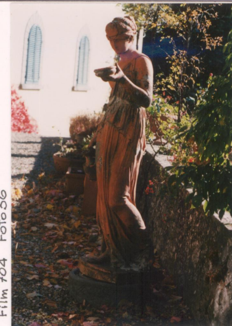
Film 704 Foto 36