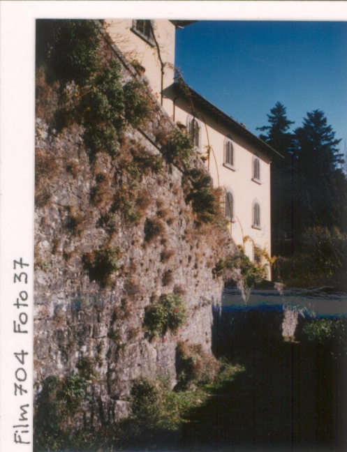
Film 704 Foto 37