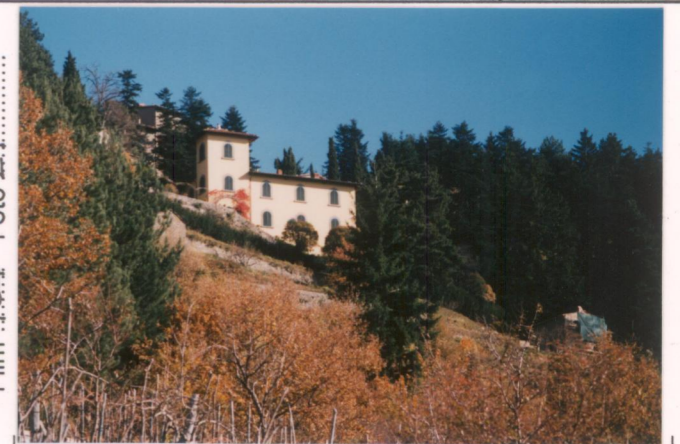
p.v. N. 3... Veduta da La Casa