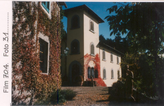
p.v. N. 5