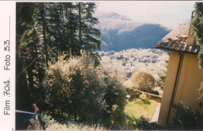
p.v. N. 6. Vista dal retro della villa