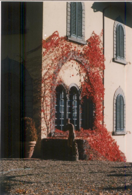
Film 704 Foto 35