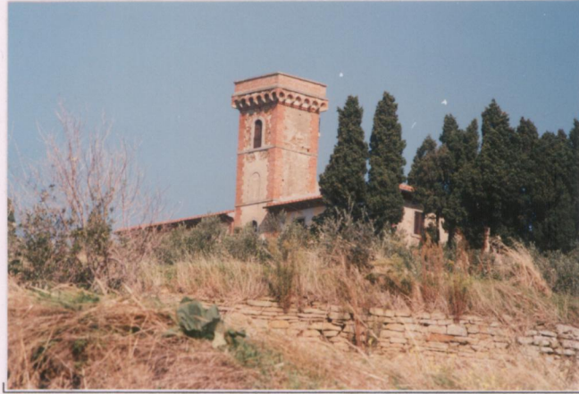
p.v. N. 3