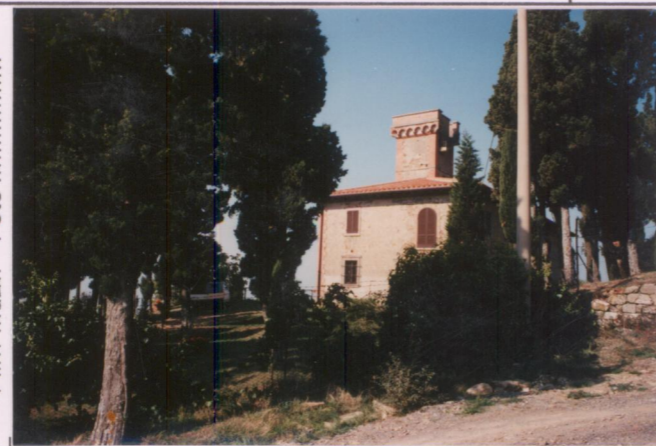
p.v. N. 6