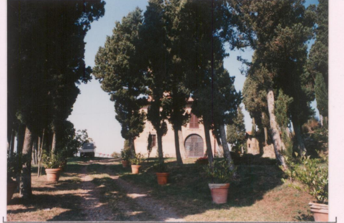
p.v. N. 4. Dall'ingresso