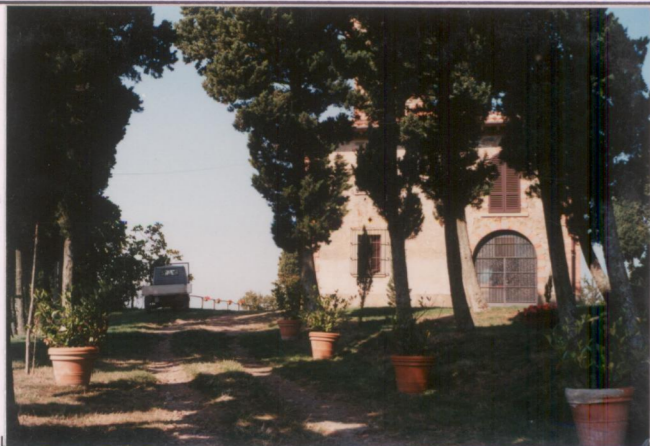
p.v. N. 5