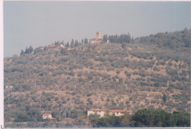
p.v. N. 1. Veduta da Pian di Scò