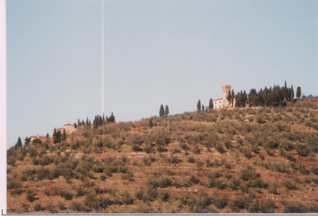
p.v. N. 2. Veduta da Casabiondo