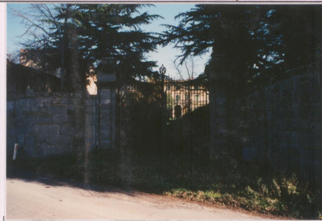
Film 592. Foto 2.....