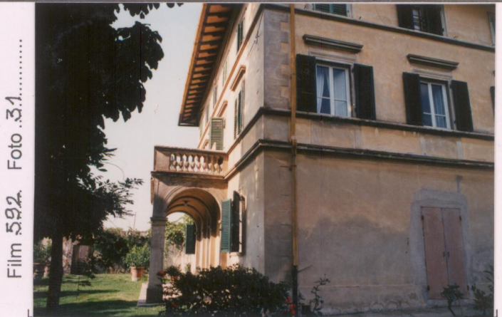
Film 592... Foto 31.....