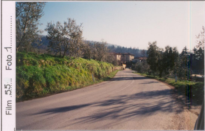
Film 55... Foto 1.....