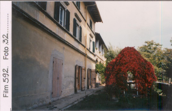
Film 592. Foto 32.....