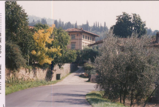
Film 592... Foto 2.....