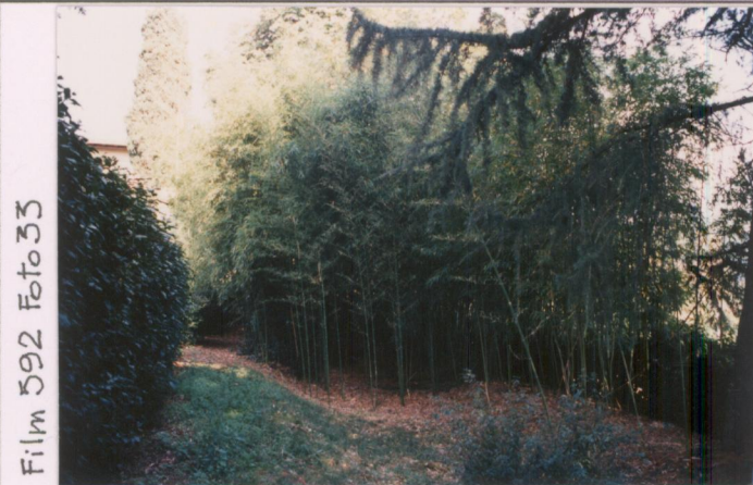
Film 592 Foto 33