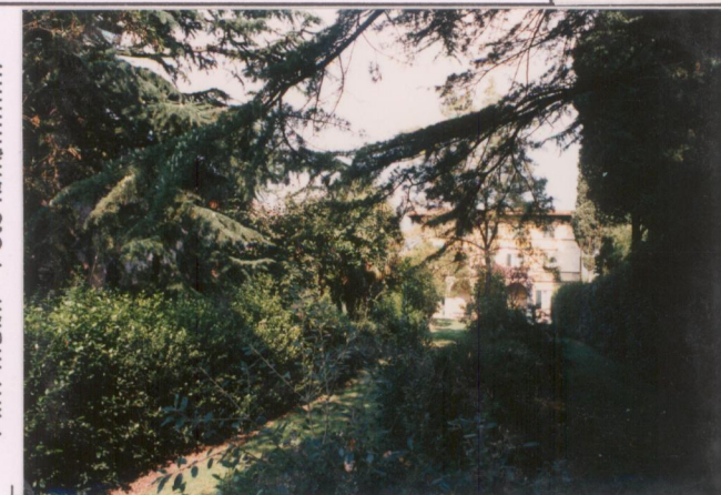
Film 592. Foto 34.....