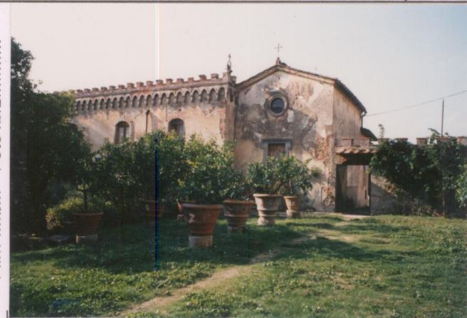
Film 592. Foto 35.....