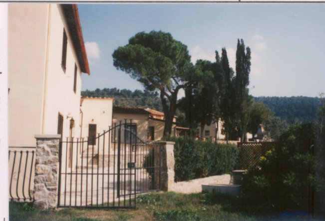
Film 592 Foto 24