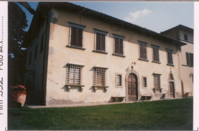
p.v. N. 4