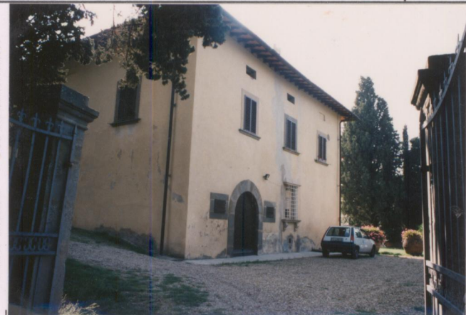
Film 592 Foto 26