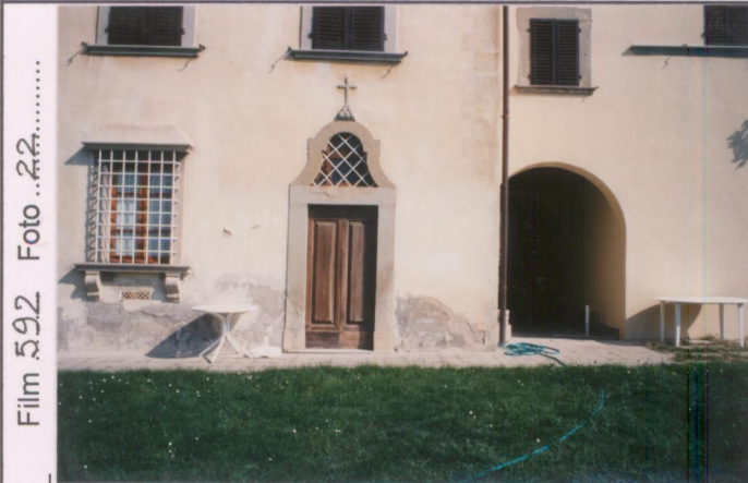
Film 592 Foto 22