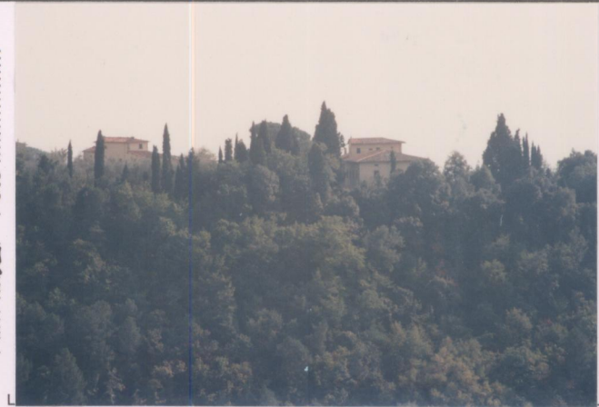
p.v. N. 2 Vista dalla strada di Pulicciano incrocio per S. Michele - I Quercioli