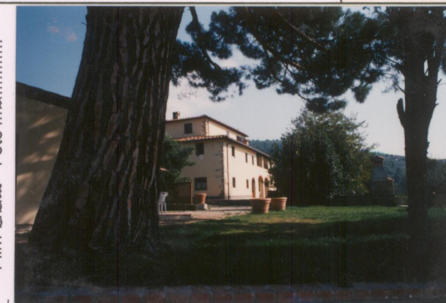
Film 592 Foto 25