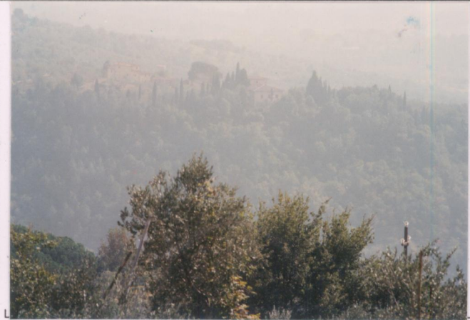
p.v. N. 1 Veduta dal cimitero di Pulicciano