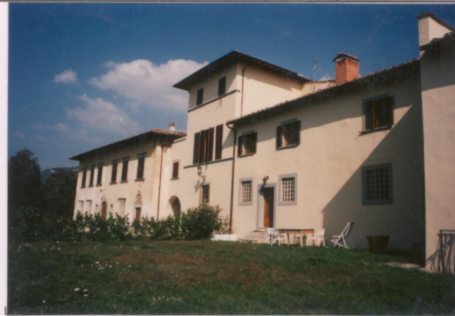
p.v. N. 3