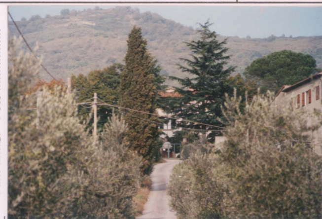
p.v. N. 3. Dalla strada Sette ponti.