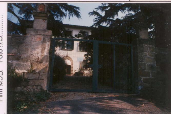
p.v. N. 4. Ingresso.