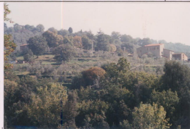
p.v. N. 2. Veduta da Malva.