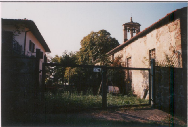
p.v. N. 5. Retro e Cappella