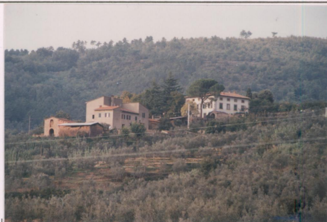
p.v. N. 1. Veduta della strada per Poggitazzi.