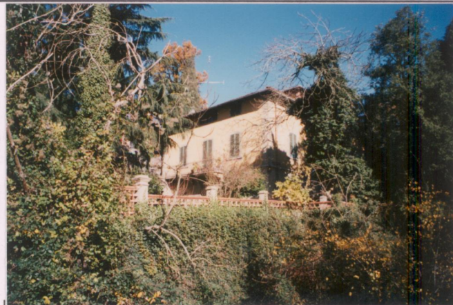
p.v. N. 1 Veduta dal ponte