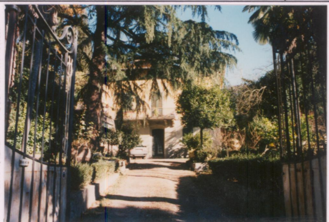
p.v. N. 2 Ingresso