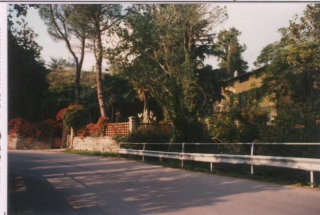
p.v. N. 3 Veduta dalla Setteponti