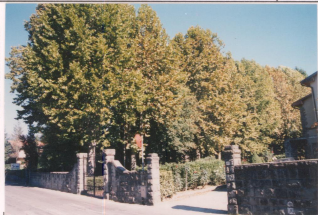
Film 647. Foto 13