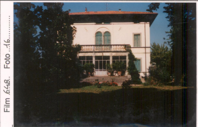
Film 648. Foto 16