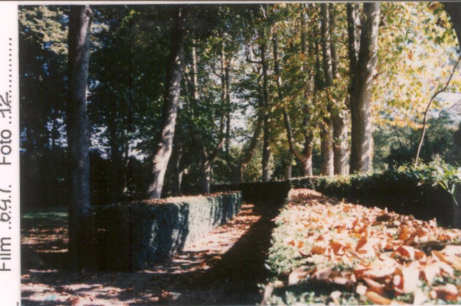
Film .64.7. Foto ..12.....