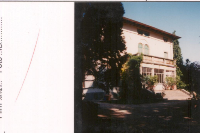
Film 647. Foto 10