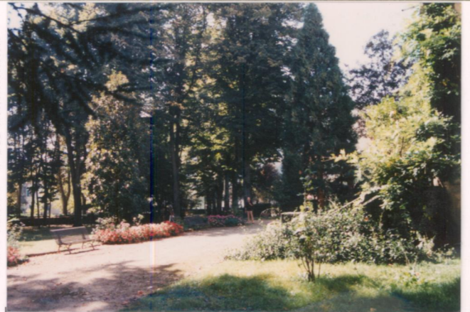
Film .64.7. Foto ..8.....