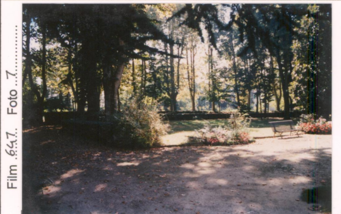
Film .64.7. Foto ..7.....