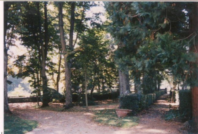
Film .64.7. Foto ..9.....