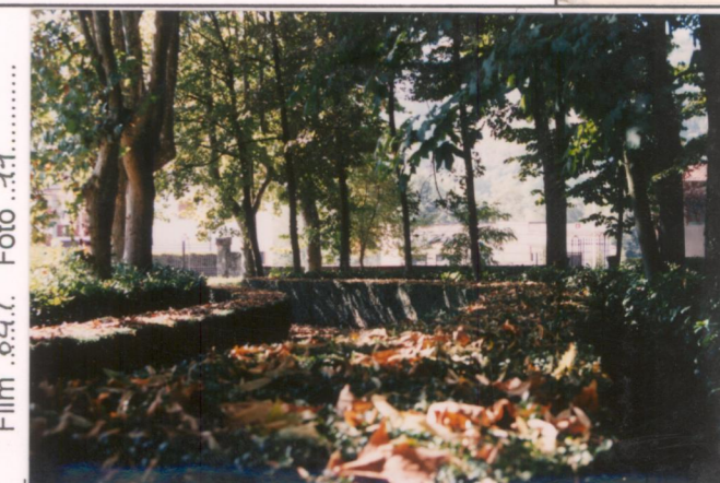
Film 647. Foto 11