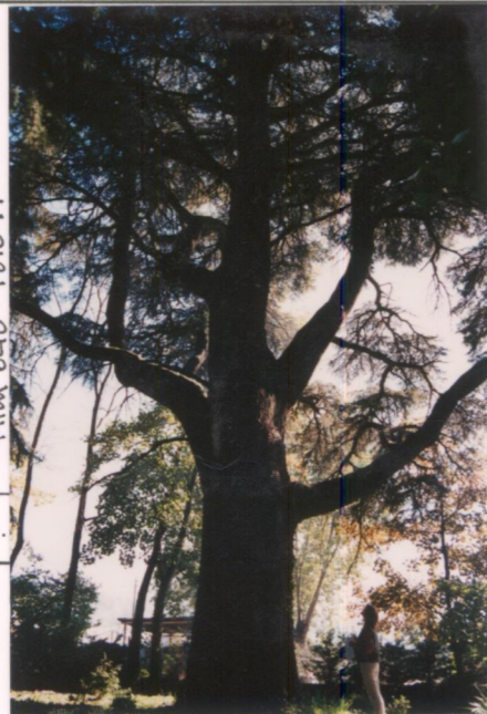
Film 648 Foto 17