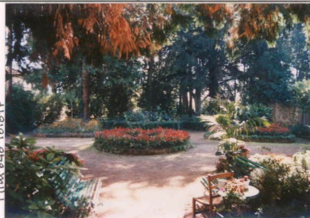
Film 648 Foto 17