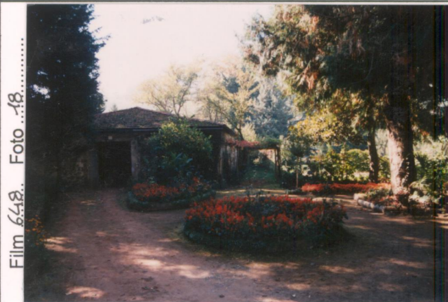
Film 648 Foto 18