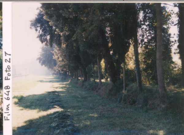
Film 648 Foto 27