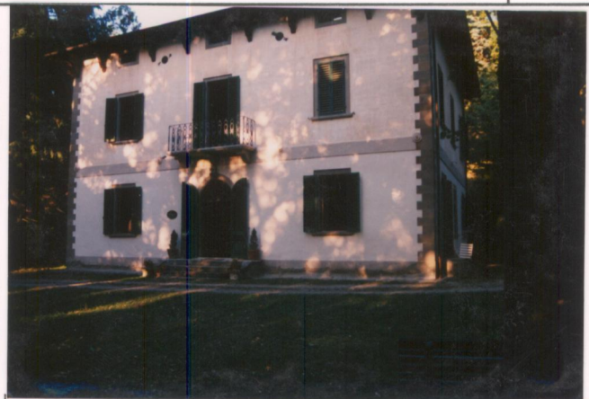
Film 6.7.1. Foto 12