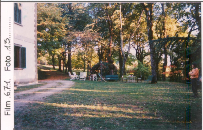
Film 6.7.1. Foto 13