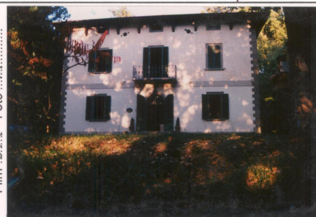
Film 6.7.1. Foto 14