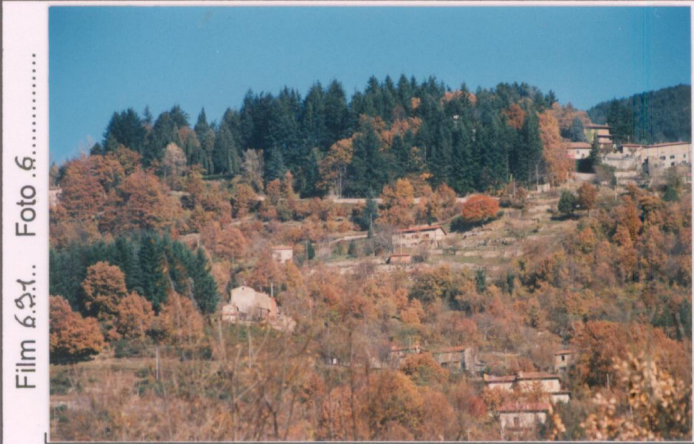
Film 6.8.1. Foto 6