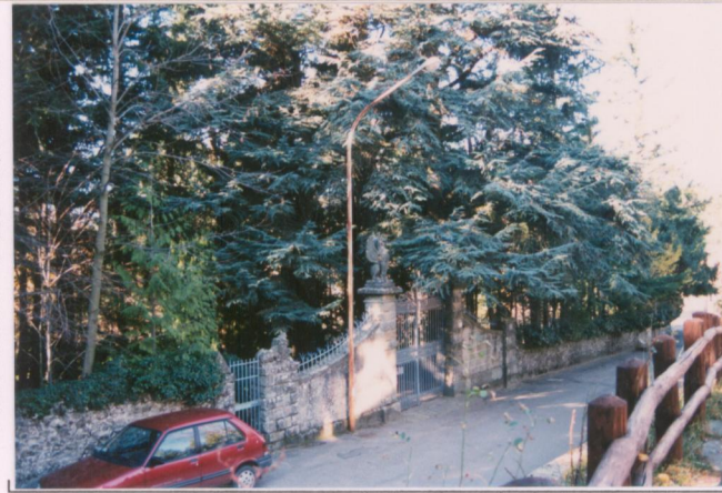
Film 6.8.1. Foto 11