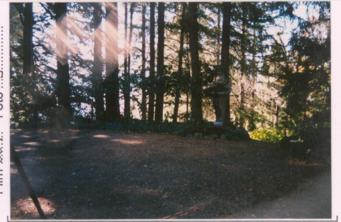
Film 6.8.1. Foto 13