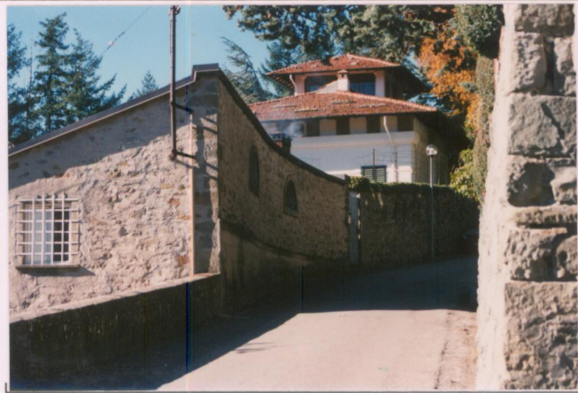
Film 6.8.1. Foto 7