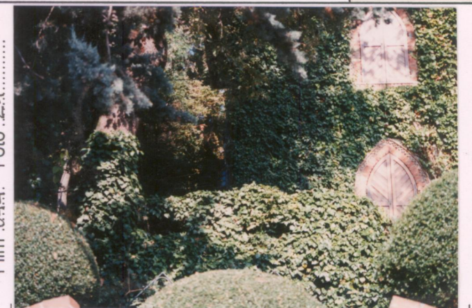
Film 644. Foto 2.1