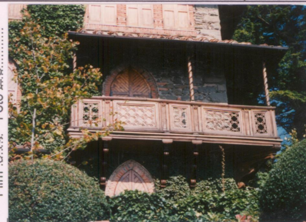
Film 644. Foto 2.3