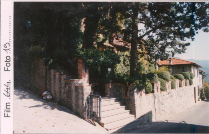
Film 644. Foto 1.9