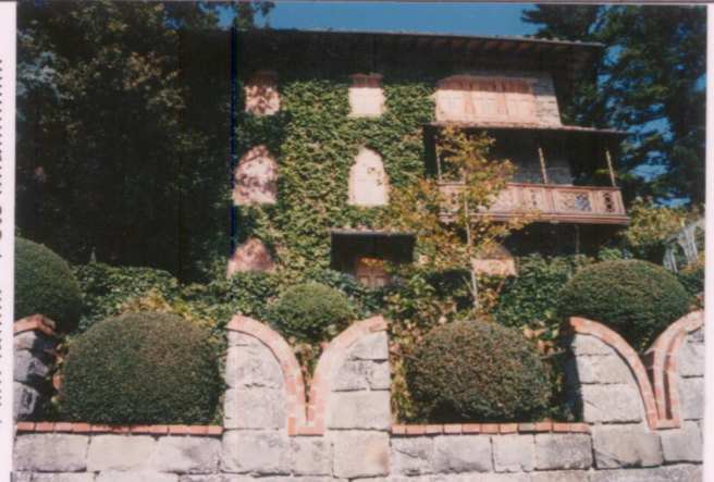
Film 644. Foto 2.0