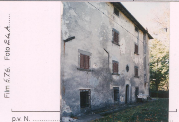
Film 6.7.6... Foto 2.4.A..... p.v. N. ....