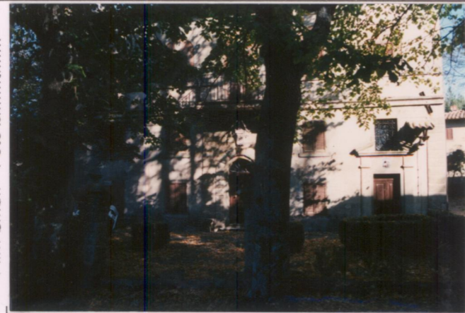
Film 6.7.6... Foto 2.1.A..... p.v. N. ....