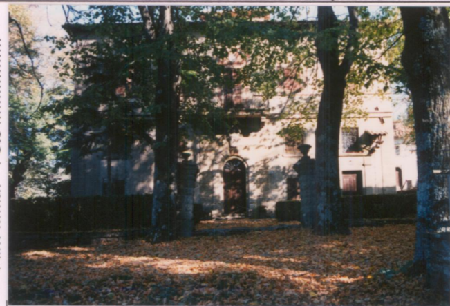
Film 6.7.6... Foto 2.3.A..... p.v. N. ....