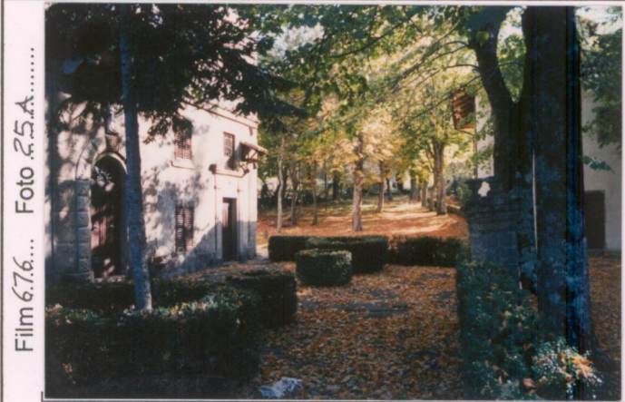
Film 6.7.6... Foto 2.5.A..... p.v. N. ....