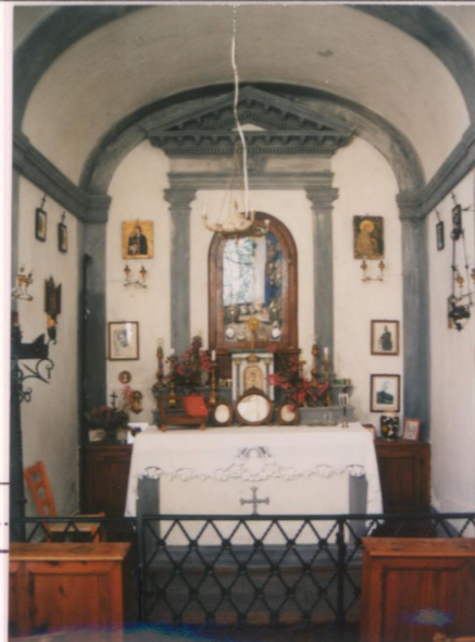
Film 6.76. Foto 2.2A.....