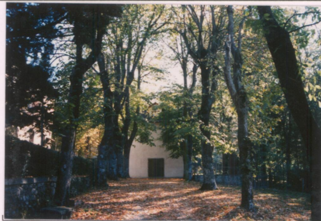
Film 6.76... Foto 2.0A.....