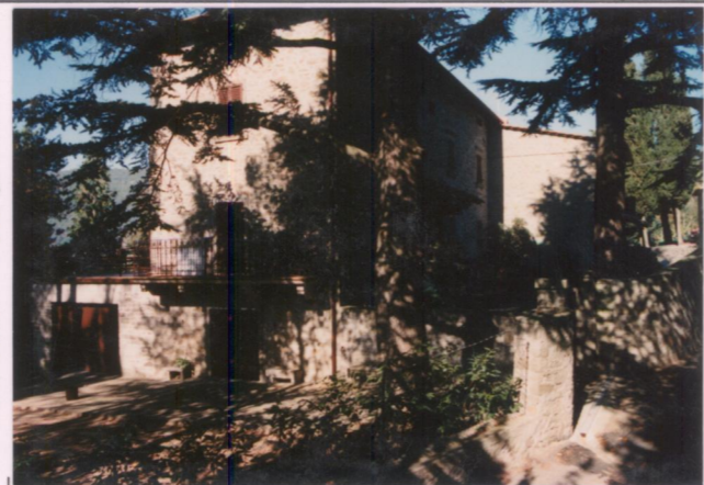
Film 6.77... Foto 2