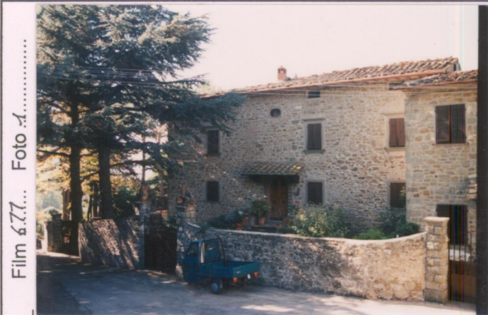
Film 6.77... Foto 1