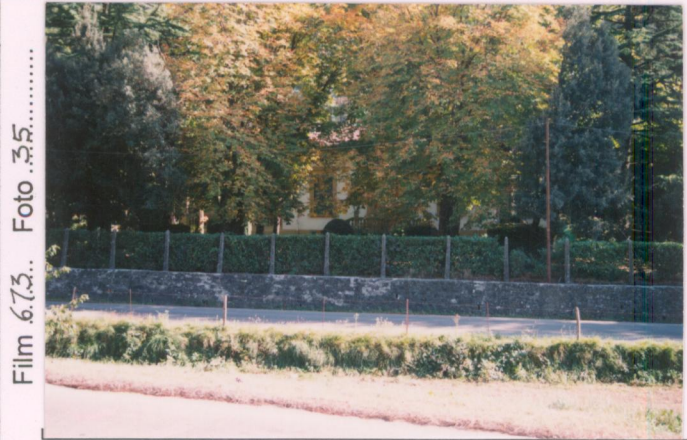
Film 6.73. Foto 32.5