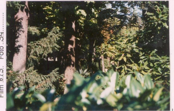
Film 6.73. Foto 34