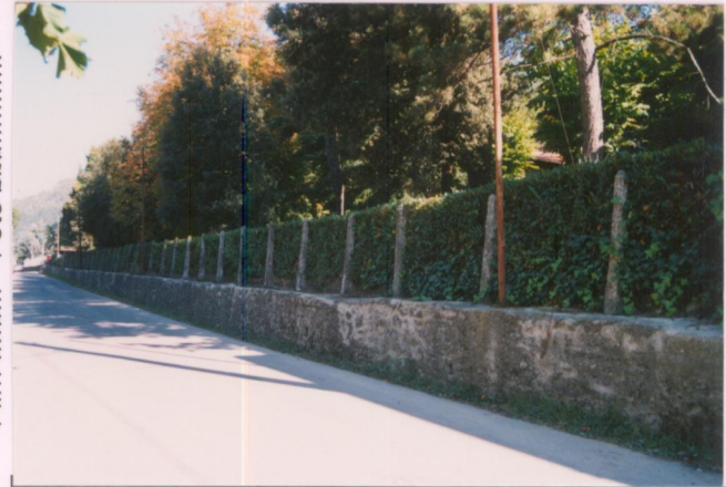
Film 6.73. Foto 32