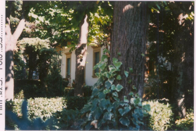
Film 6.73. Foto 33