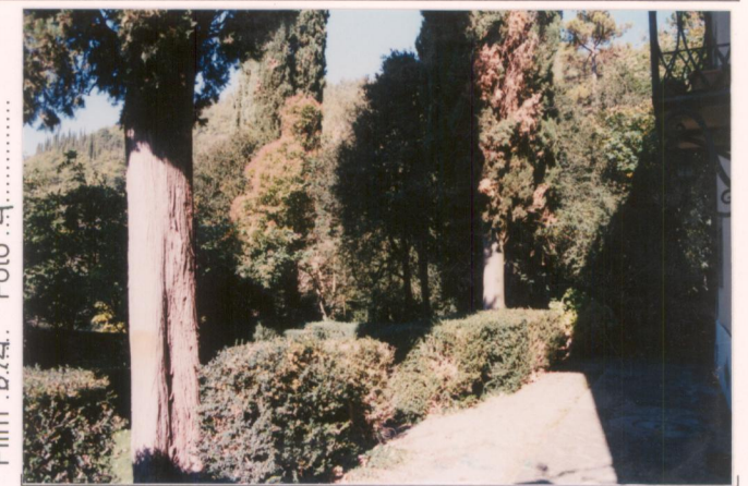
Film 6.74... Foto 4