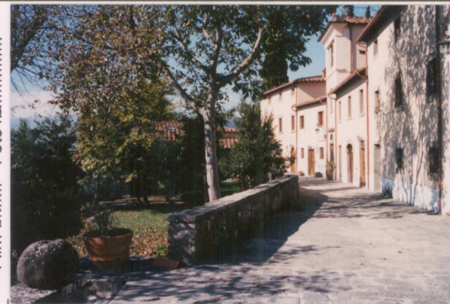
Film 6.74. Foto 5