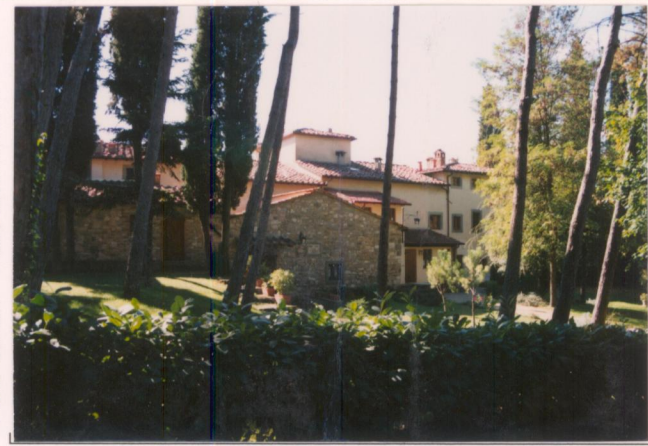
Film 6.75... Foto 36