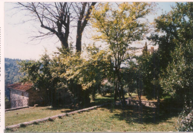
Film 6.74... Foto 2