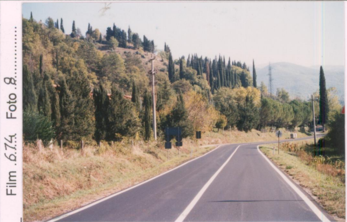
Film 6.74. Foto 2