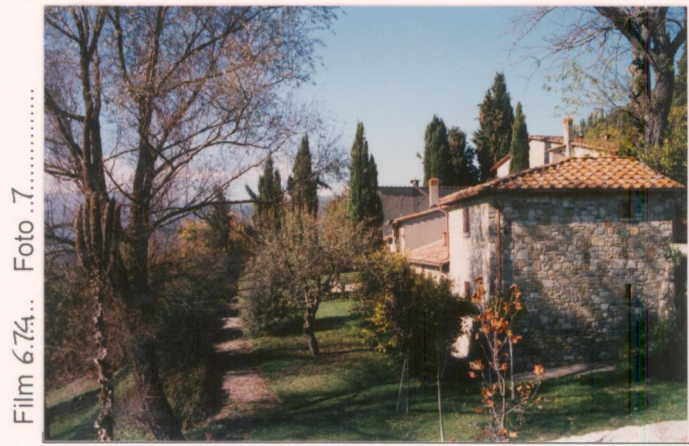
Film 6.74... Foto 7