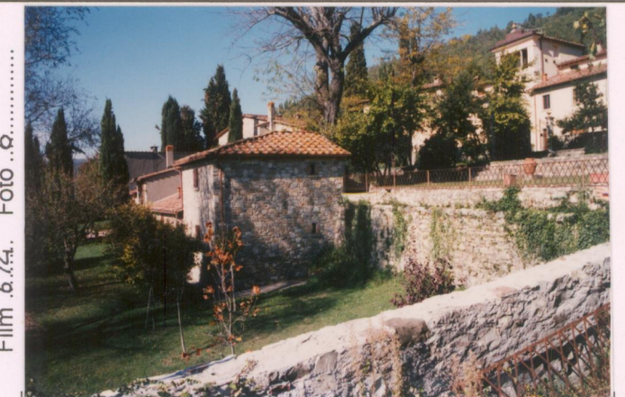
Film 6.74. Foto 6