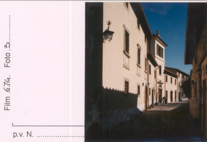
Film 6.74. Foto 3