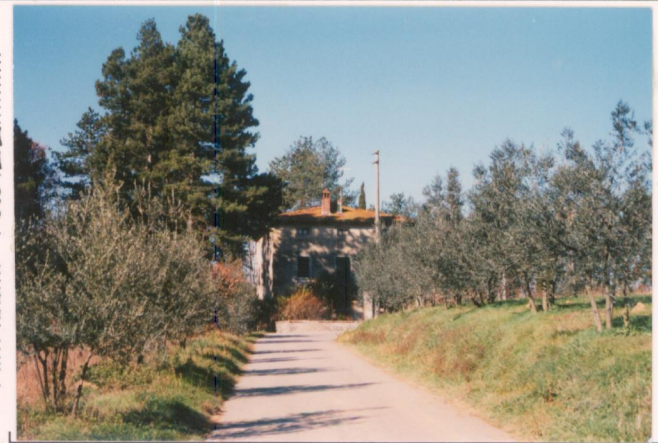
Film .6.9.1. Foto .2.2.....