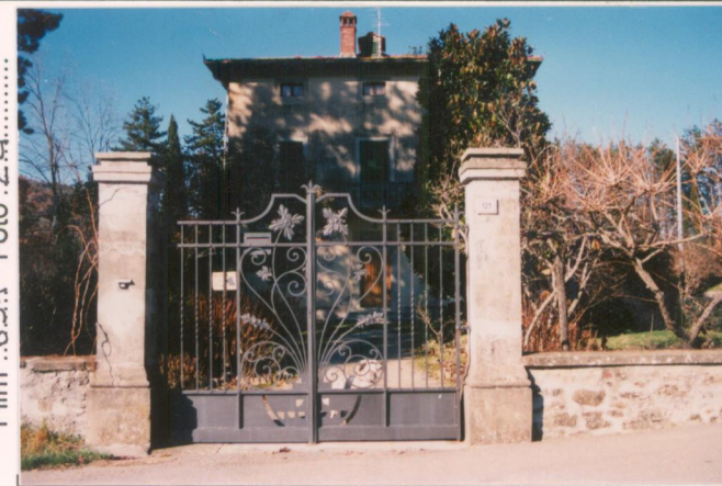
Film .6.9.1. Foto .2.4.....