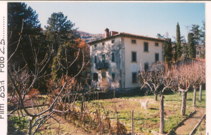
Film .6.9.1. Foto .2.3.....