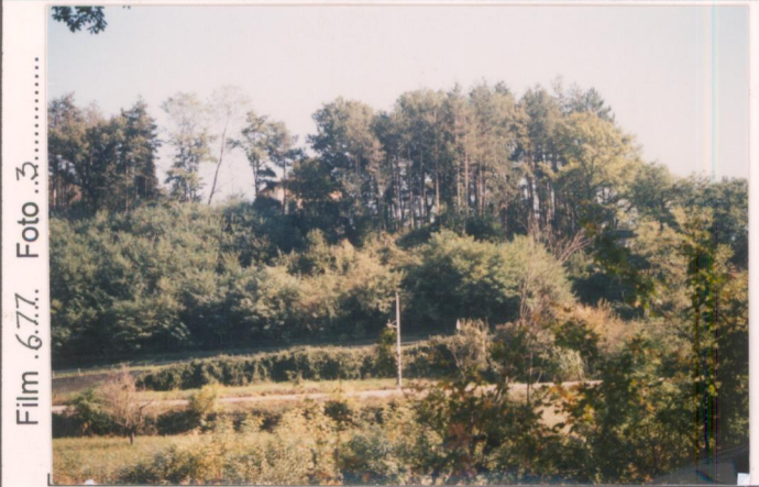
Film .6.7.7. Foto .3.....