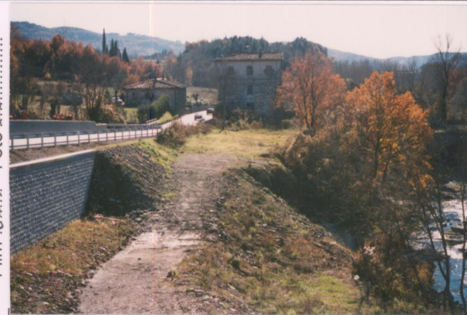
Film 69.1 Foto 28