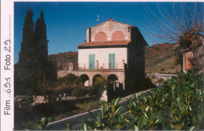
Film 69.1 Foto 29