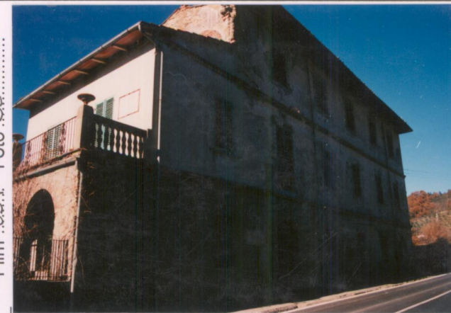
Film 69.1 Foto 30