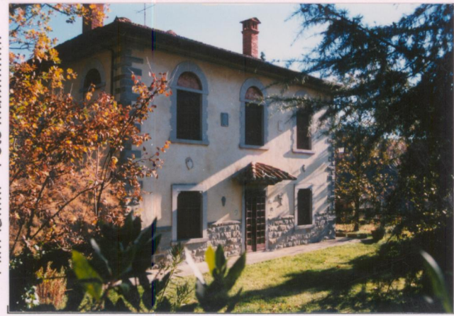
Film 621. Foto 32.