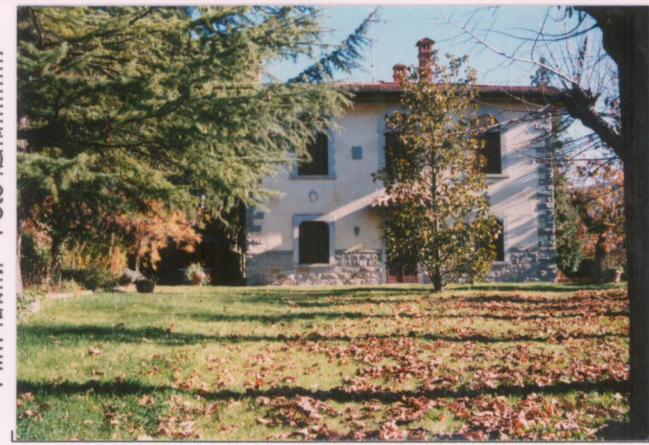
Film 621. Foto 31.