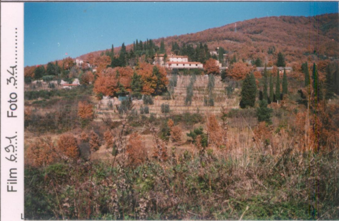
Film 621. Foto 34.