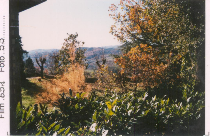
Film 621. Foto 33.