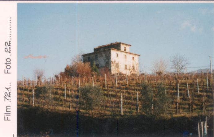
Film 72-1... Foto 22