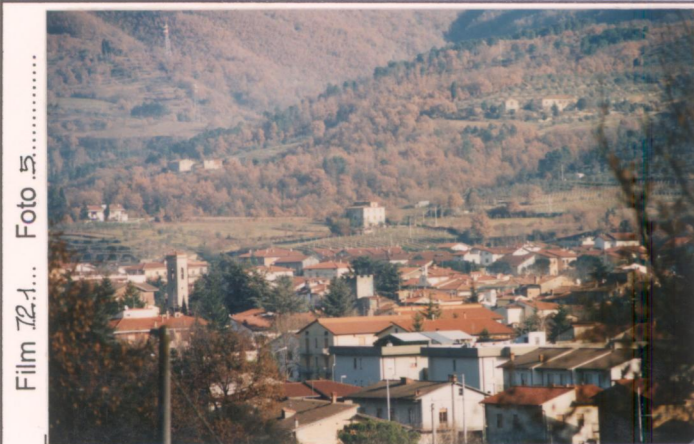
Film 72-1... Foto 5