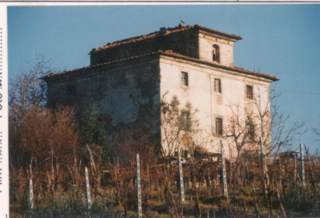
Film 72-1... Foto 21