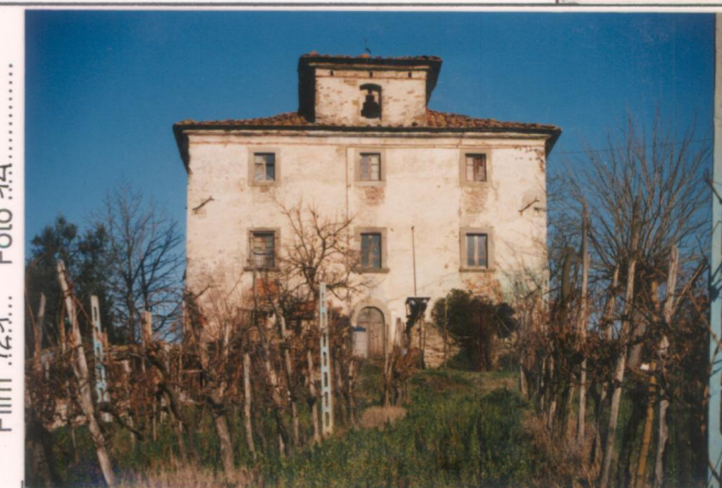
Film 72-1... Foto 14