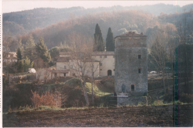
p.v. N. Il Palazzo ed in primo piano La Torre Soldini