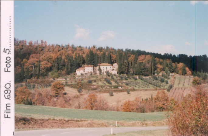
Film 69Q. Foto 5.