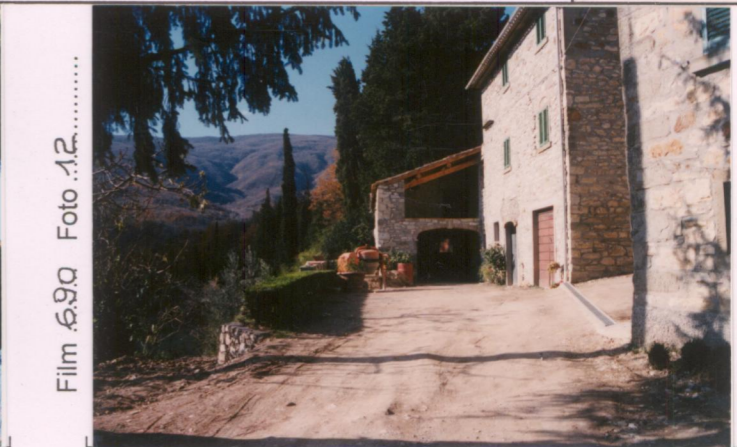
Film 69Q. Foto 12.