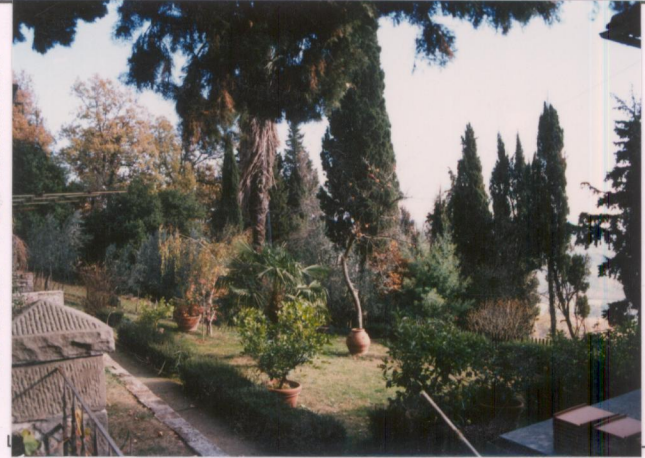
p.v. N. 5