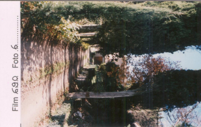
Film 69Q. Foto 6.