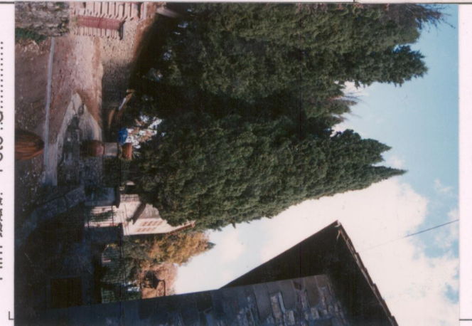
p.v. N. 8