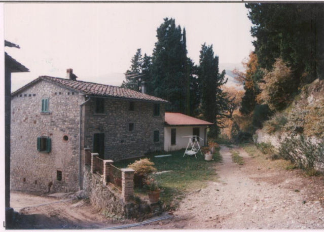
p.v. N. 7