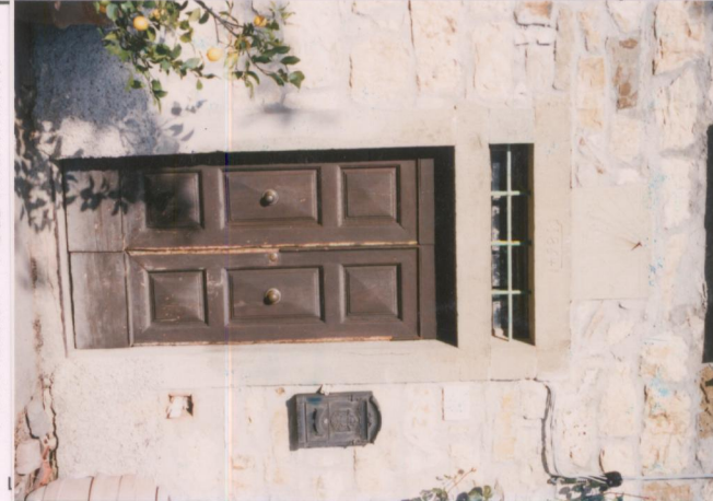
p.v. N. 6