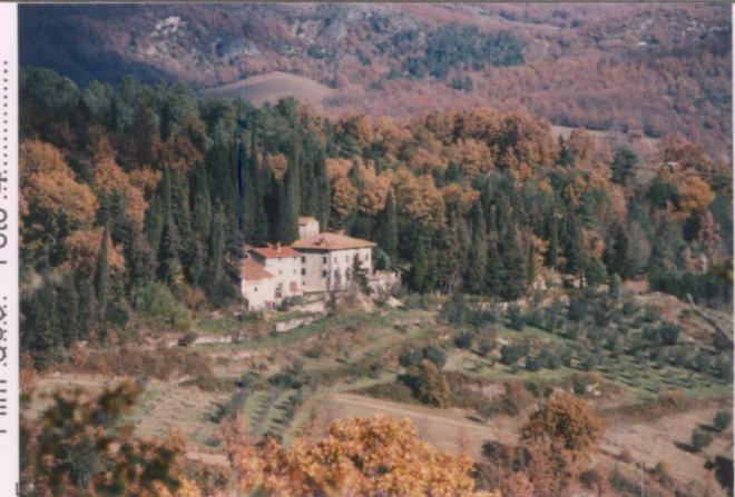
Film 69Q. Foto 4.