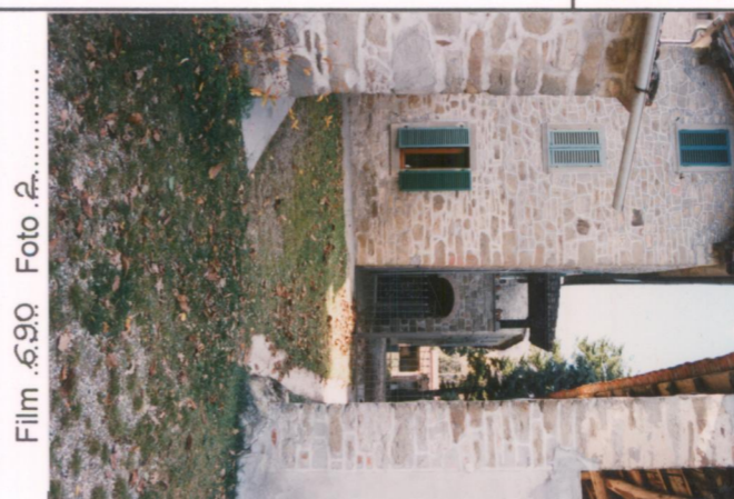
Film 690 Foto 2