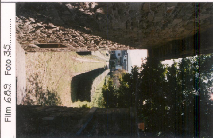
Film 689 Foto 35