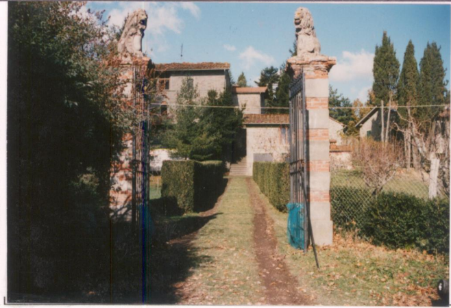
Film 6.89. Foto 33