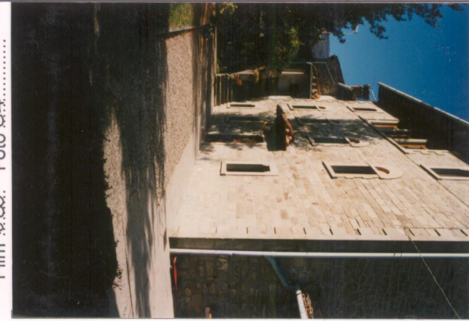
Film 6.89. Foto 34