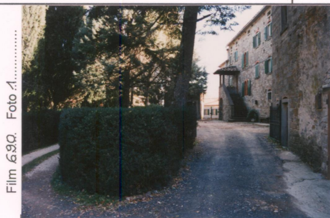
Film 690 Foto 1