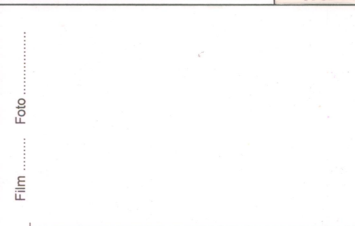
Film ..... Foto .....