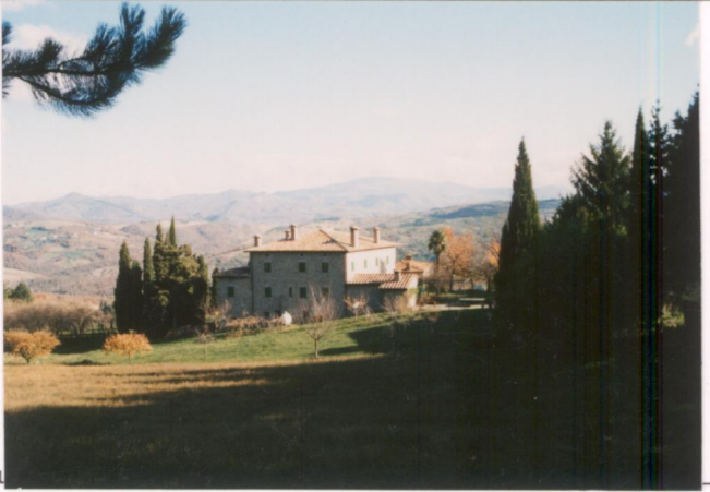
p.v. N. 1