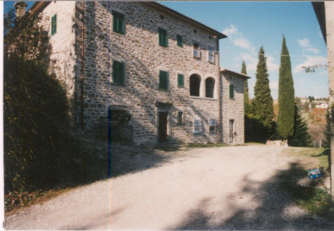
p.v. N. 2