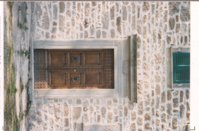
p.v. N. 4