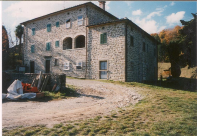
p.v. N. 3