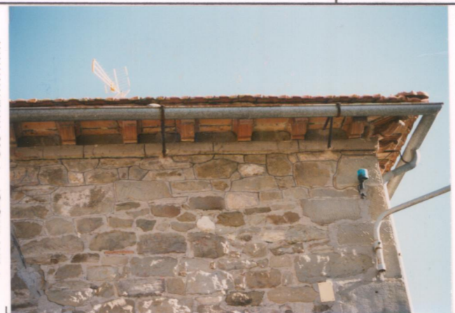
Film 689. Foto 25