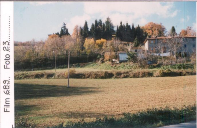
Film 689. Foto 23