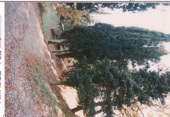
Film 689. Foto 26