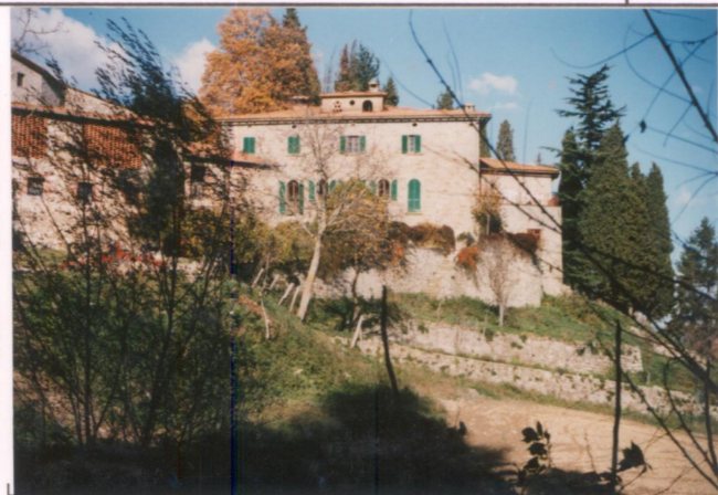
Film 689. Foto 24