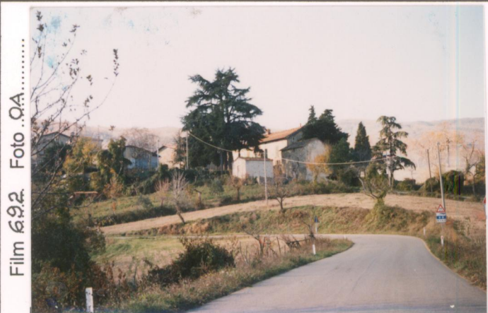
Film 692 Foto 0A