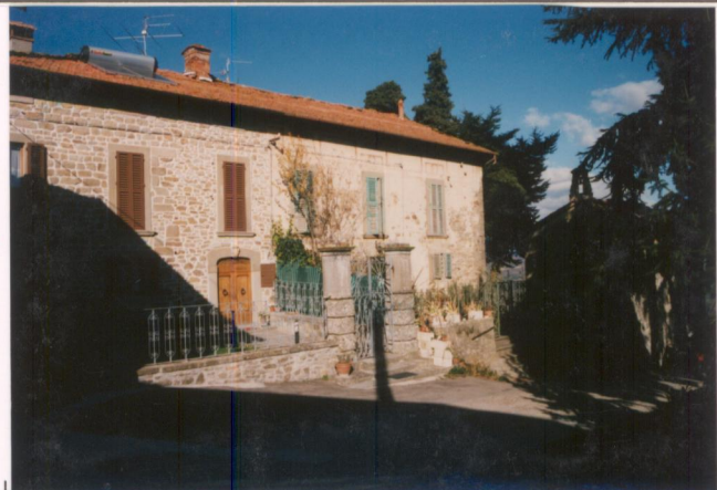
Film 690 Foto 34