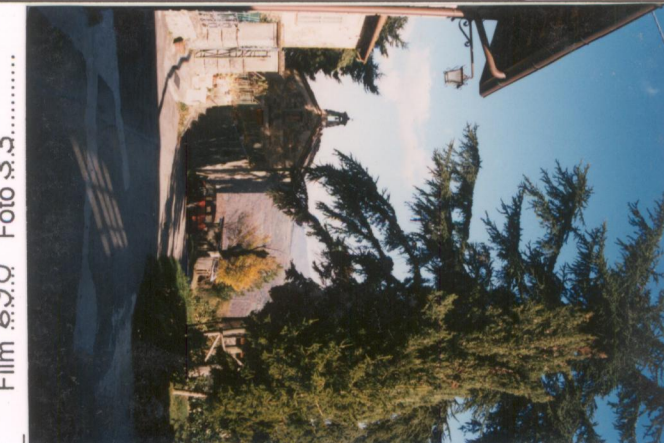
Film 690 Foto 33