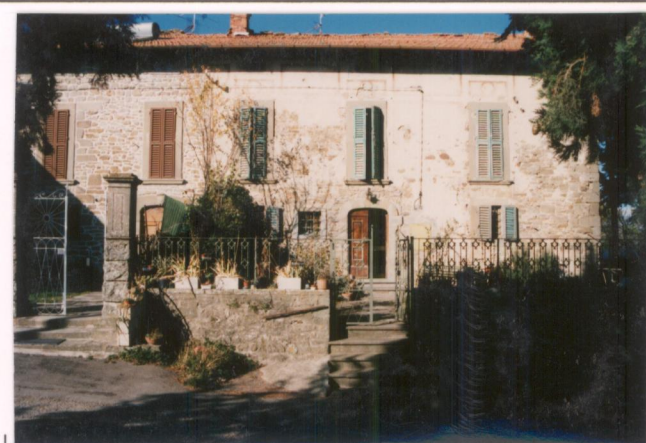
Film 690 Foto 36