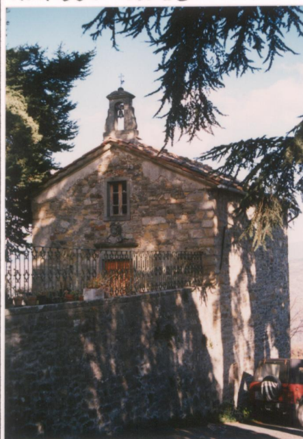
Film 690 Foto 35