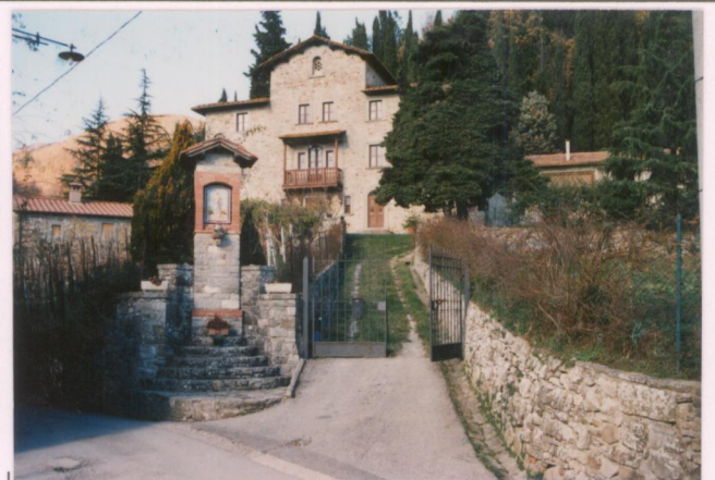
Film 692 Foto 1A p.v. N.3