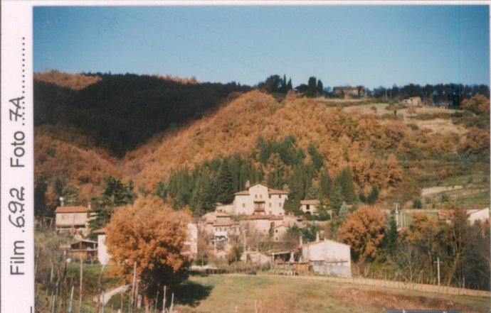
Film 692 Foto 7A p.v. N.1