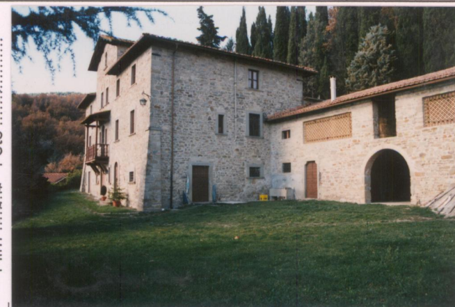
Film 692 Foto 2A p.v. N.4