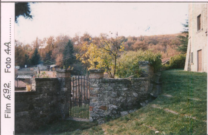
Film 692. Foto 4A.....