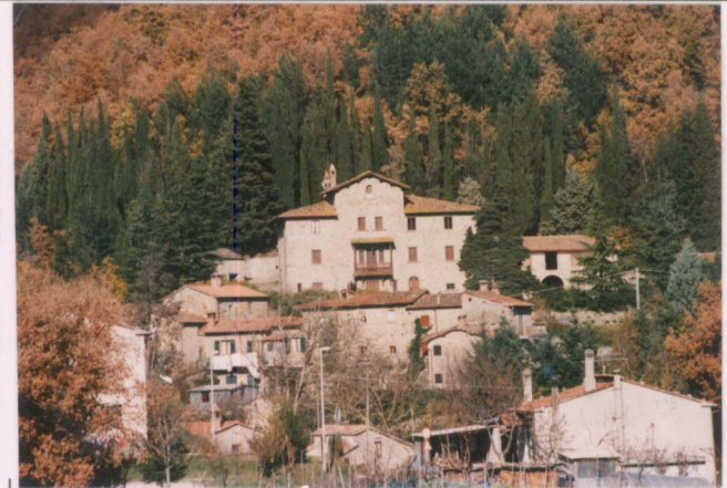
Film 692 Foto 8A p.v. N.2