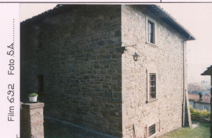
Film 692. Foto 5A.....