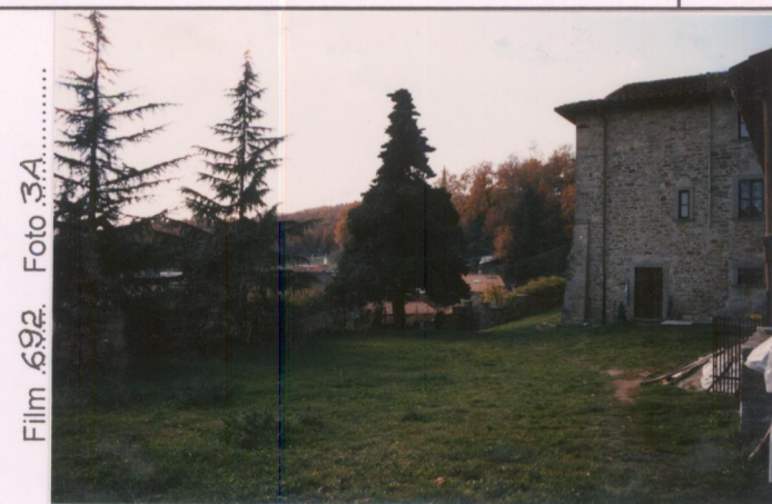
Film 692. Foto 3A.....