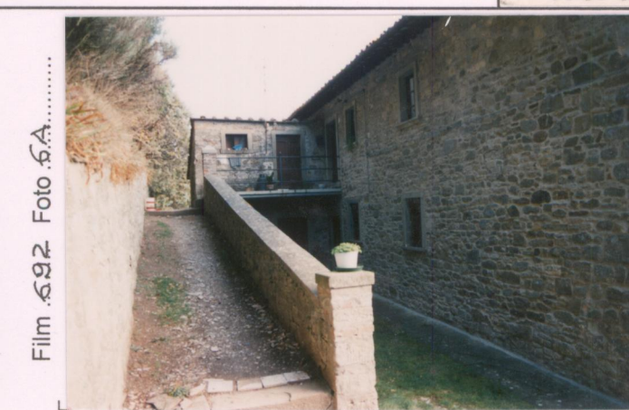
Film 692. Foto 6A.....