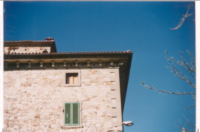
p.v. N. 4