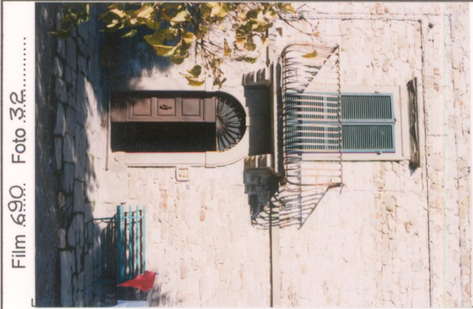
Film 690 Foto 32