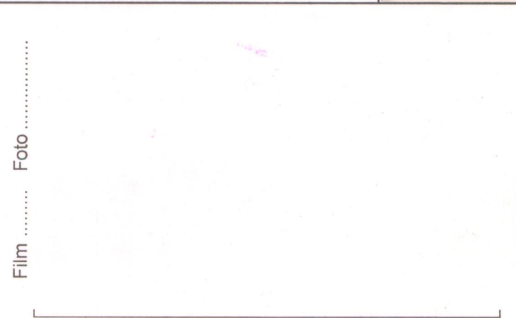
Film ..... Foto .....