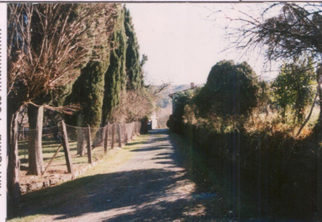
Film 690 Foto 20