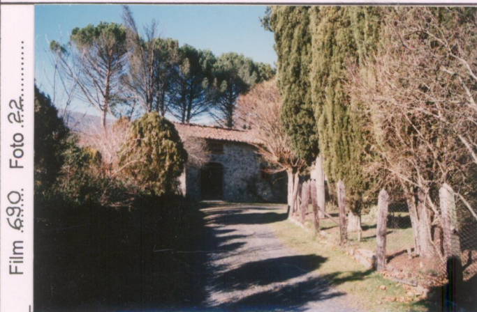
Film 690. Foto 22