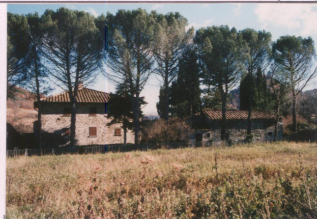
Film 690 Foto 16