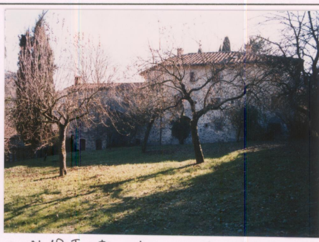
p.v. N. 10: Fronte nord e pomario Film 690 Foto 25