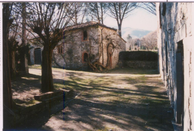
Film 690. Foto 24