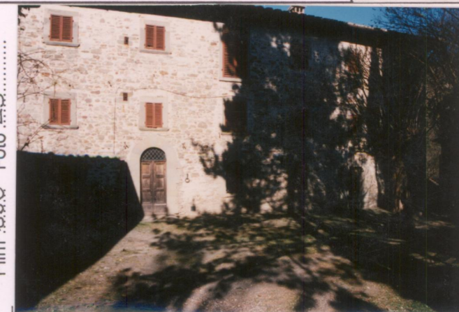
Film 690 Foto 23