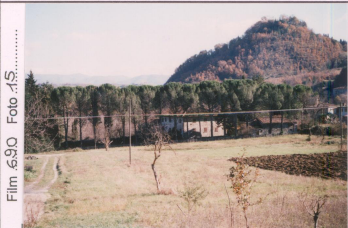
Film 690 Foto 15