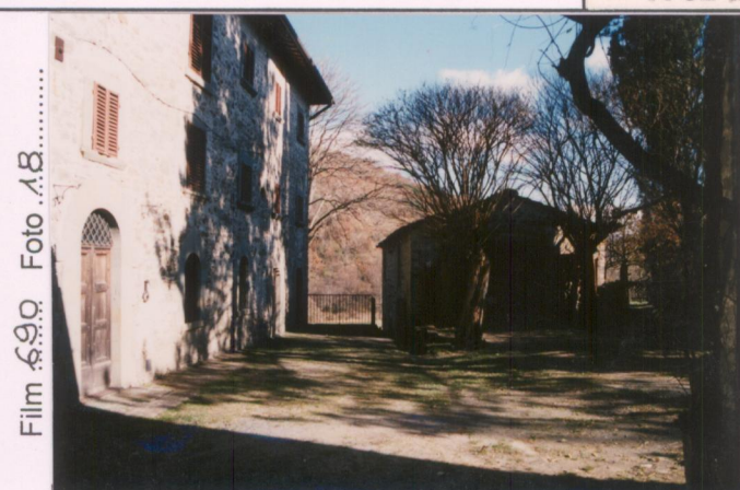
Film 690. Foto 28