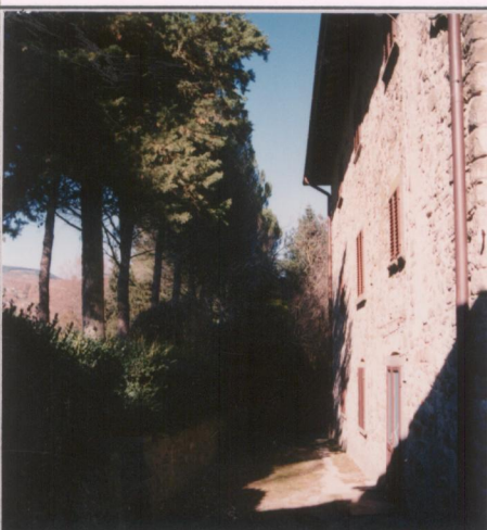
p.v. N. 9: Fronte ovest Film 690 Foto 19