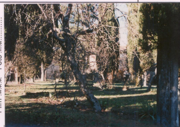
Film 690. Foto 26