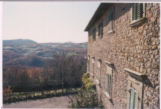
p.v. N. 7 L'affaccio verso la valle del Singerna