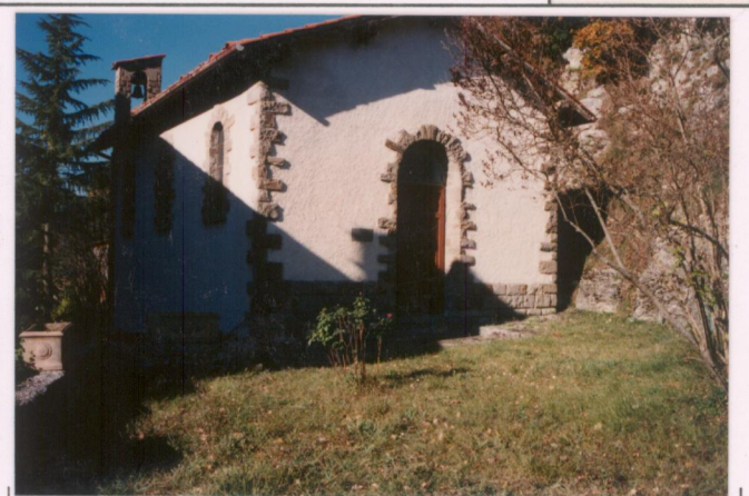
p.v. N. 8 La cappella