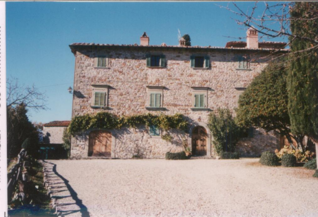
p.v. N. 3. Il fronte sud-est