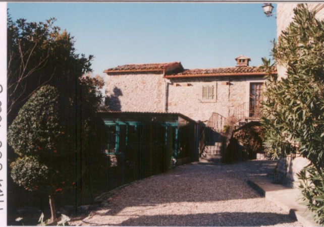
La casa colonica contigua