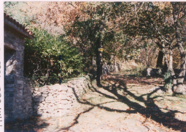
Il percorso che sale al cacumine della Rocca