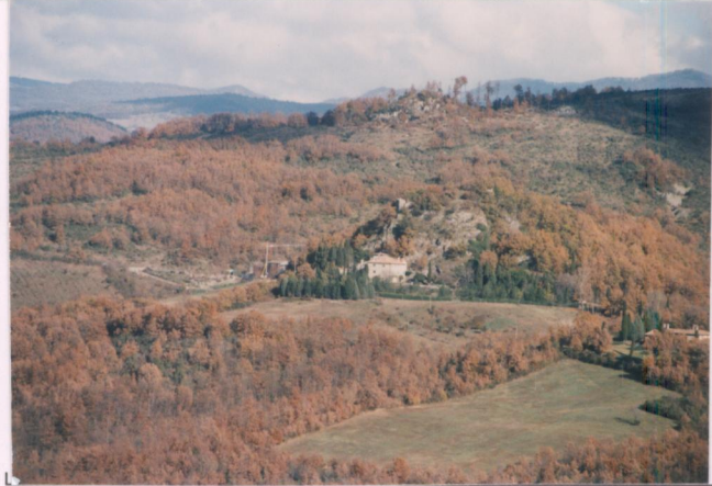
p.v. N. 1. vista della strada Anghiani-Caprese