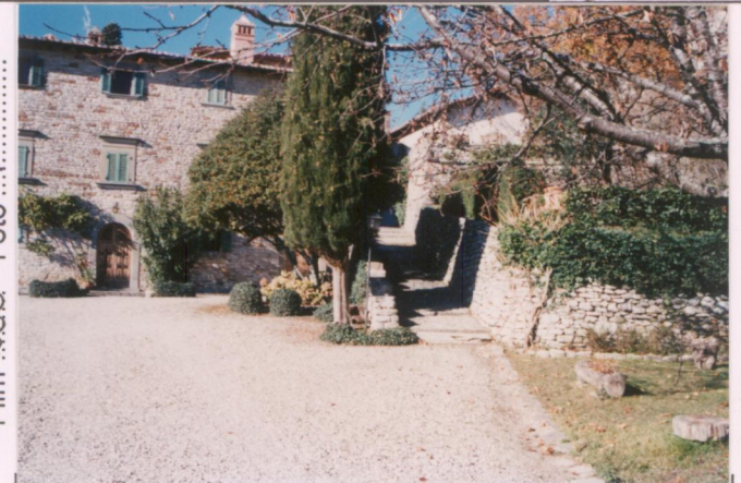
p.v. N. 4