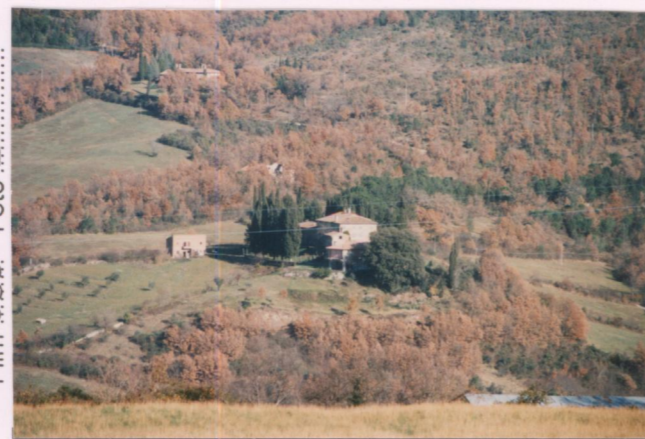
Film 685. Foto 22