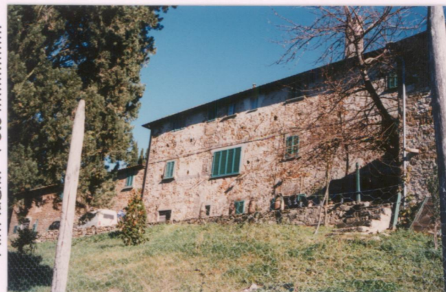
Film 685. Foto 33A