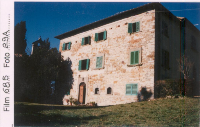
Film 685 Foto 29A