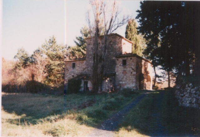
Film 685 Foto 35A