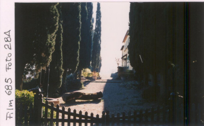
Film 685 Foto 28A