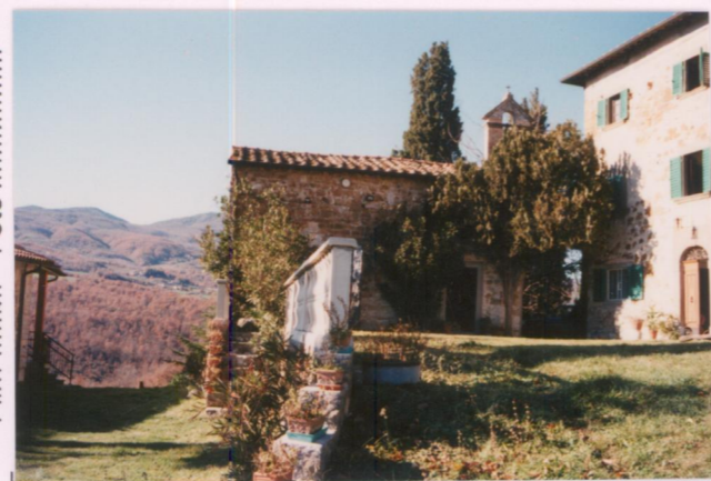
Film 685. Foto 30A