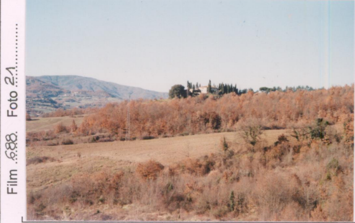
Film 688. Foto 21