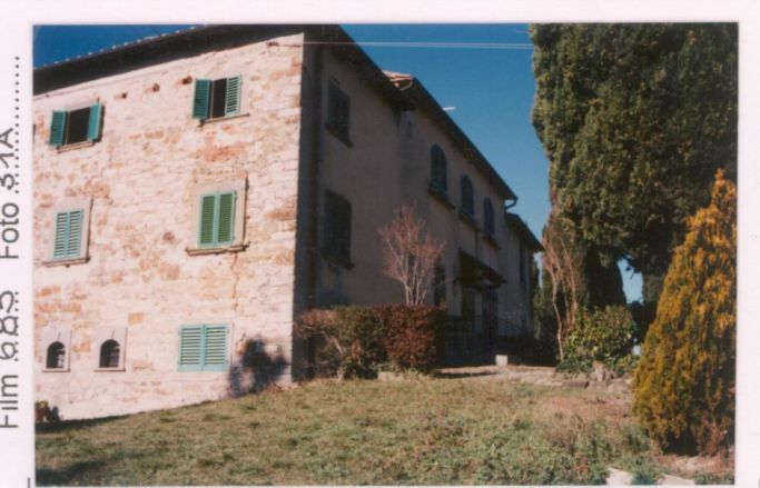
Film 685. Foto 31A