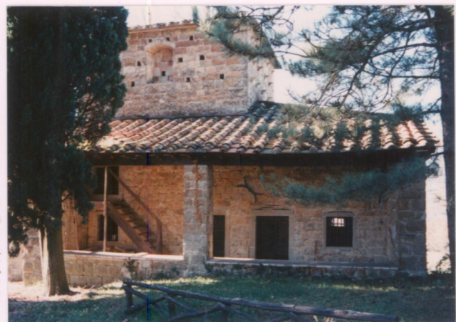
Film 688 Foto 2