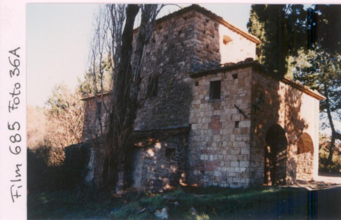
Film 685 Foto 36A