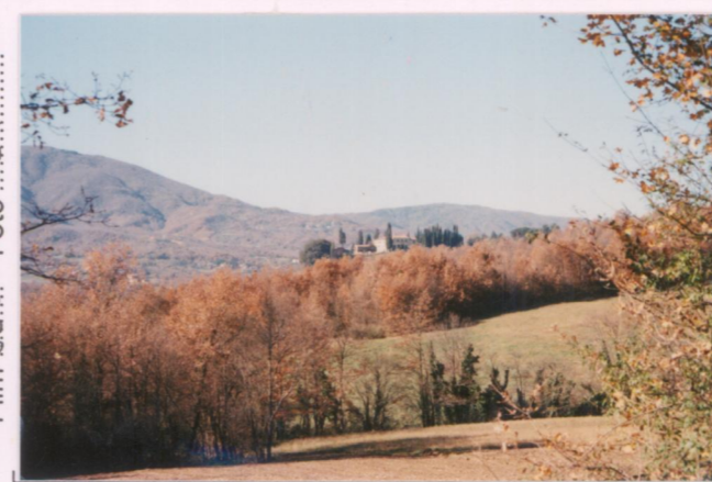
Film 685. Foto 26A