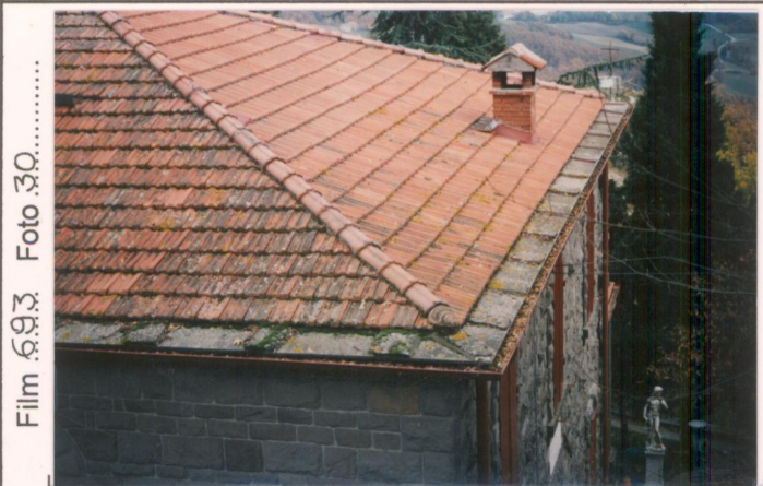
Film 693 Foto 30