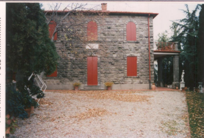
Film 693. Foto 2.7