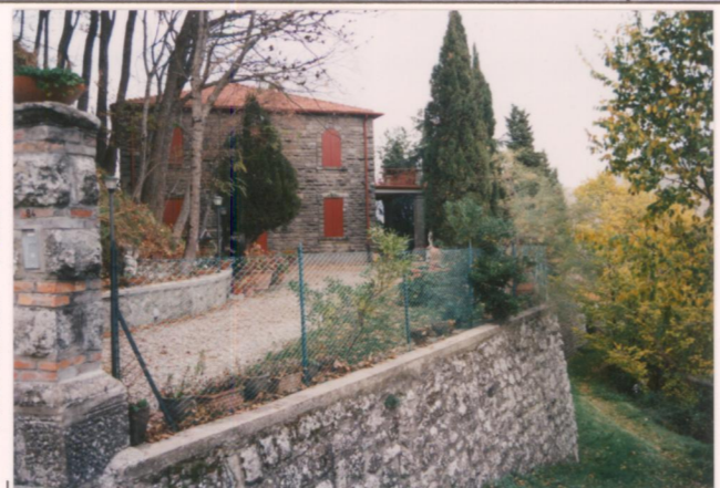
Film 693. Foto 2.2