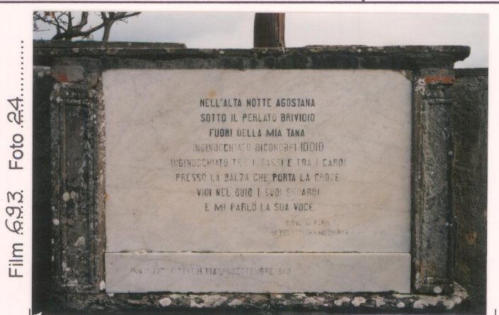
Film 693 Foto 24