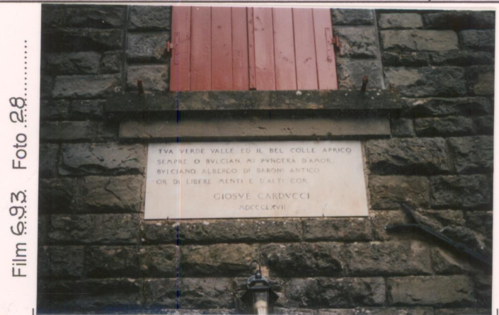
Film 693 Foto 28