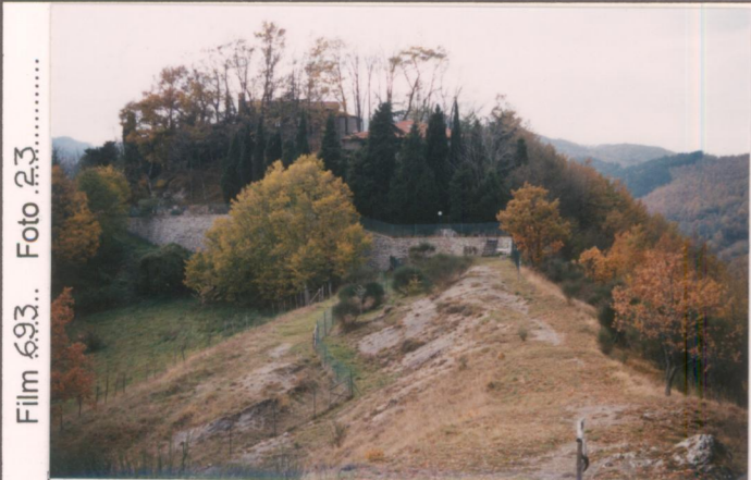
Film 693.. Foto 2.3