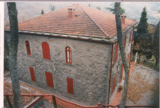
Film 693. Foto 2.6