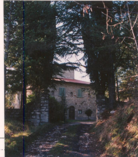
p.v. N. ....