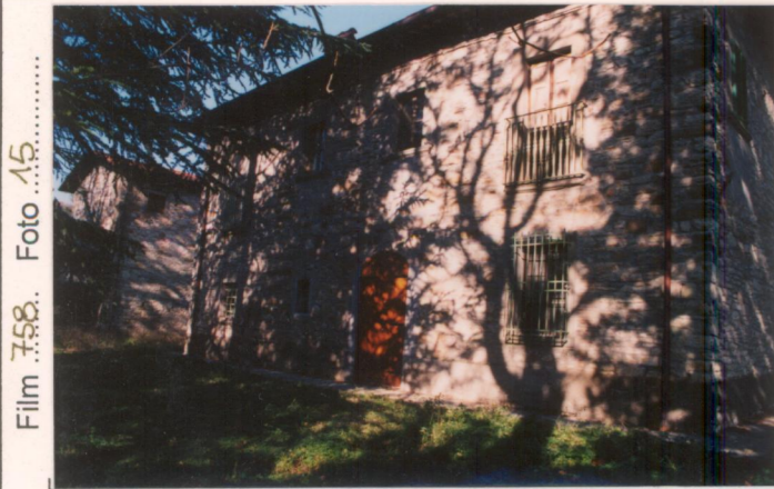
Film 758. Foto 15