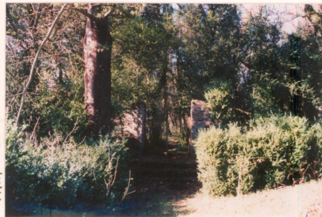
Film 758 Foto 11