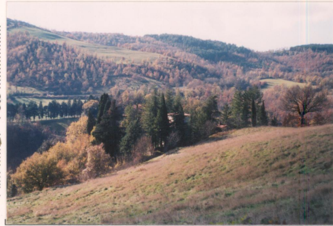
p.v. N. Vista dalla strada per Mignano