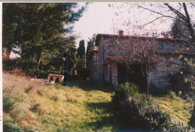
Film 758 Foto 8