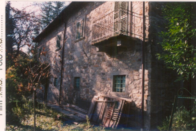
Film 758. Foto 18