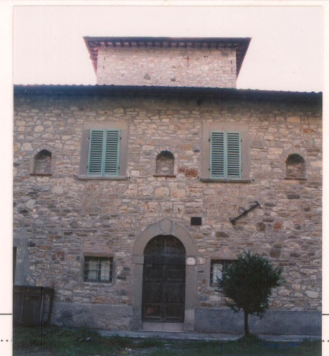
p.v. N. ....