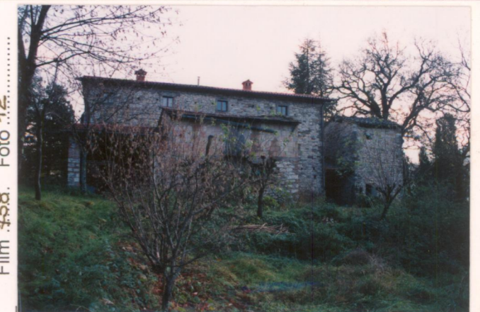
Film 758. Foto 12