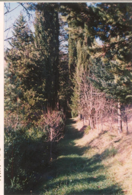
Film 758 Foto 7