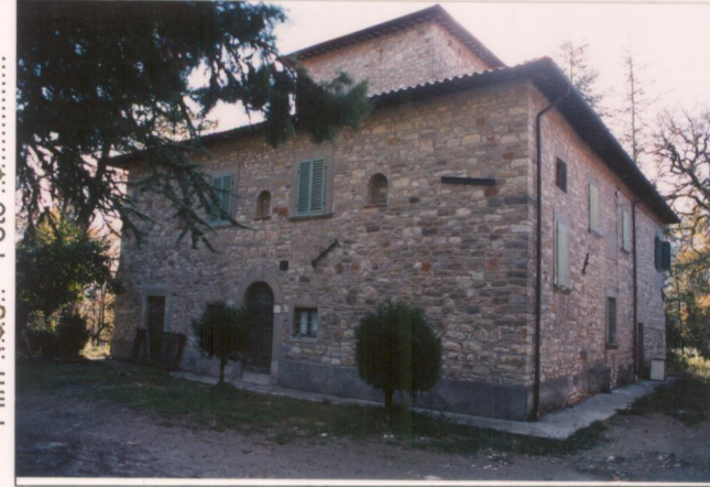
p.v. N. ....