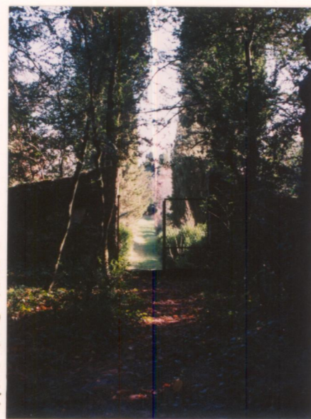
Film 758 Foto 9