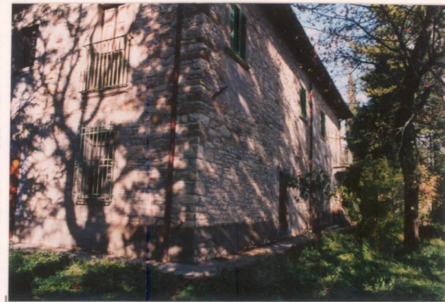
Film 758. Foto 16