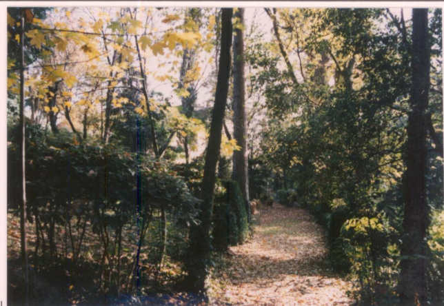
p.v. N. 10