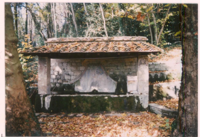
p.v. N. 13