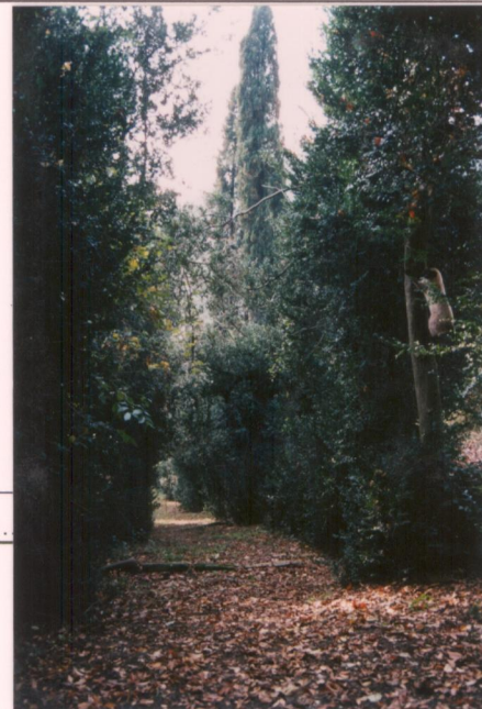
p.v. N. 11