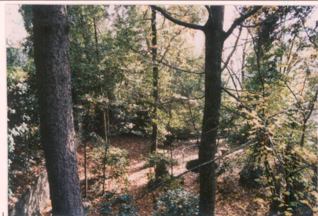
p.v. N. 9