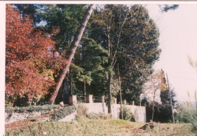
p.v. N. 12