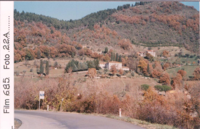
Film 685. Foto 22A.....