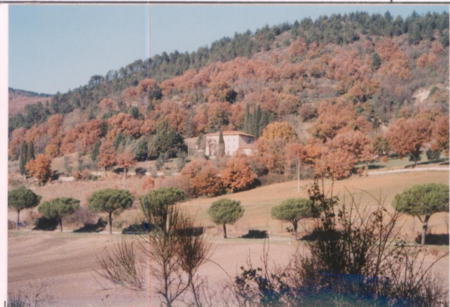
Film 685. Foto 18A.....