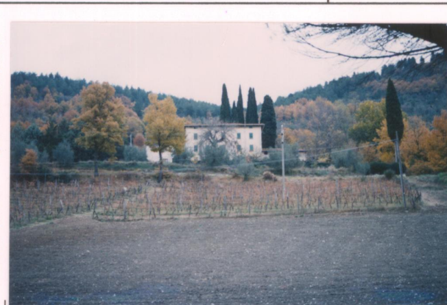
Film 693. Foto 32.....