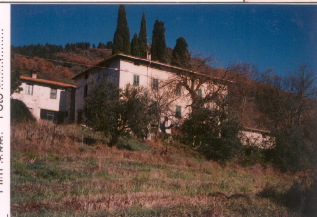
Film 685. Foto 21A.....