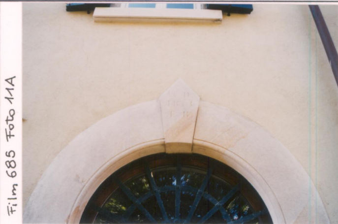
Film 685 Foto 11A