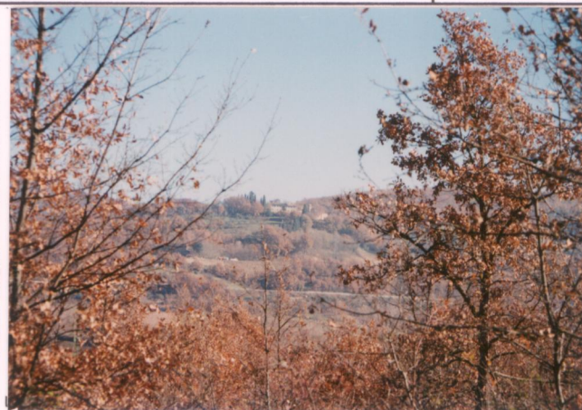
p.v. N. 3. Vista dal Monte Fungia.....