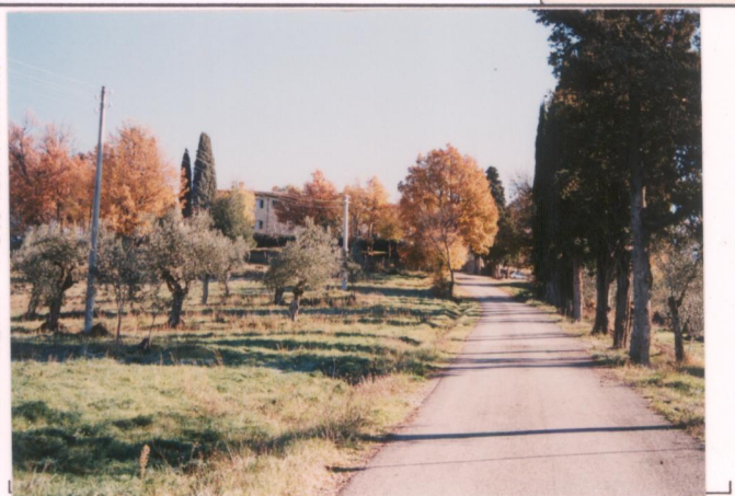
p.v. N. 4. viale di accesso da ovest.....