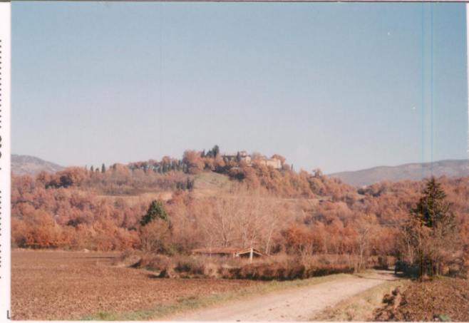
p.v. N. 1. Vista dalla strada Tiberina 3 bis.....