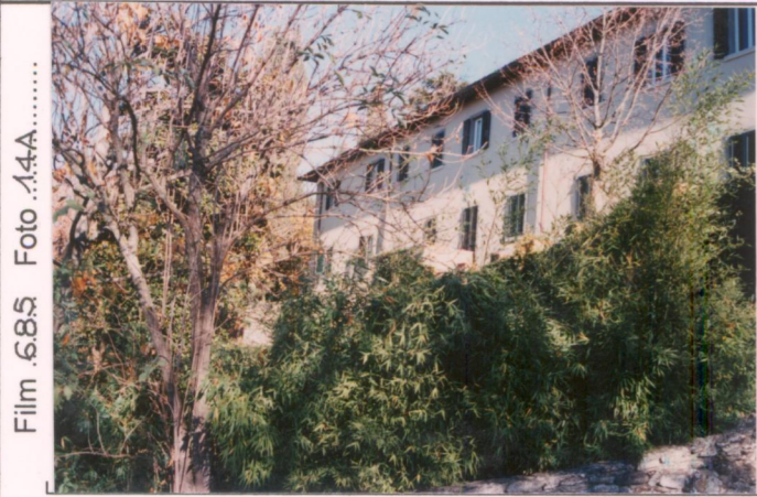
Film 685 Foto 14A