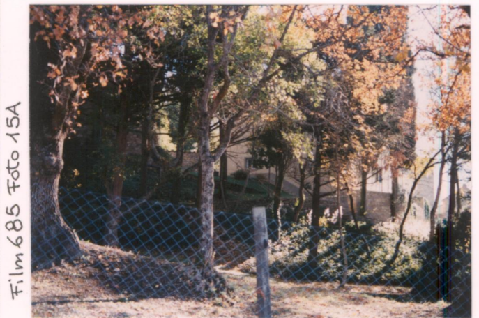
Film 685 Foto 15A