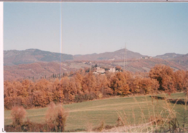
p.v. N. 2. Vista da villa.....