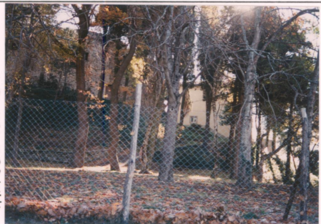
Film 685 Foto 16A