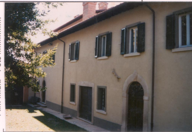
Film 685 Foto 12A