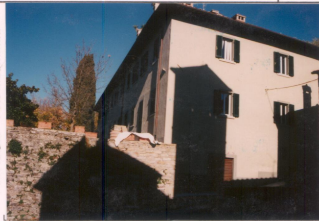
Film 685 Foto 9A