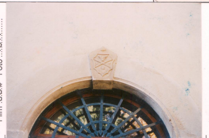
Film 685 Foto 10A