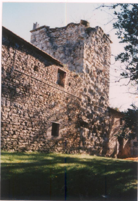
Film 685 Foto 12A