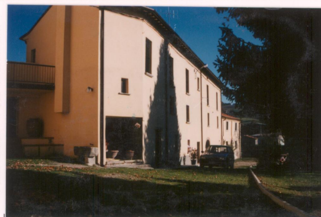
p.v. N. la facciata sud degli alloggi per l'agriturismo