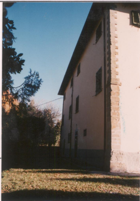
Il fronte nord-ovest con l'accesso alla cappella