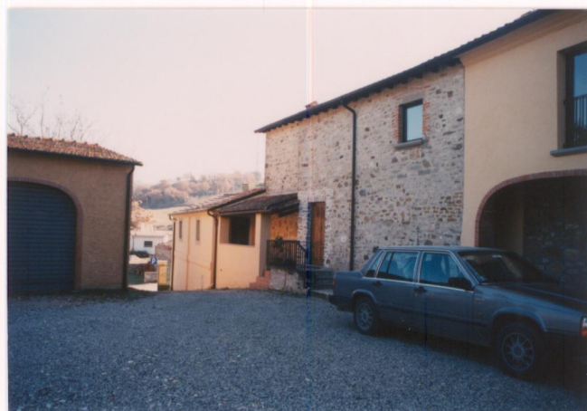
Film 685 Foto 5A