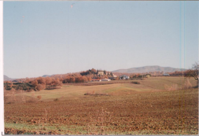
p.v. N. Vista dalla Tiberina 3 bis