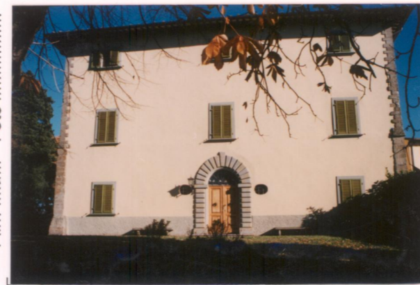
p.v. N. Il fronte sud-ovest