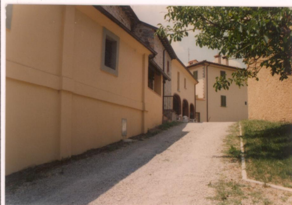
Film 460 Foto 36