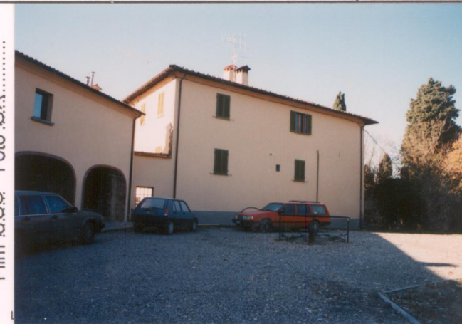
p.v. N. Il fronte nord-est