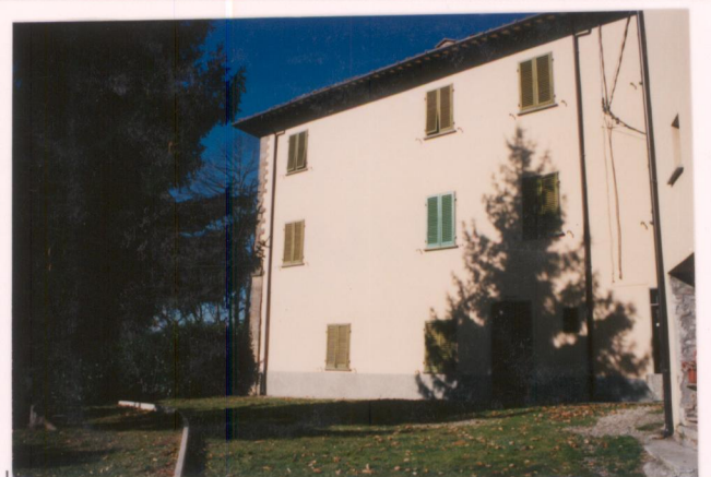
p.v. N. Il fronte sud-est