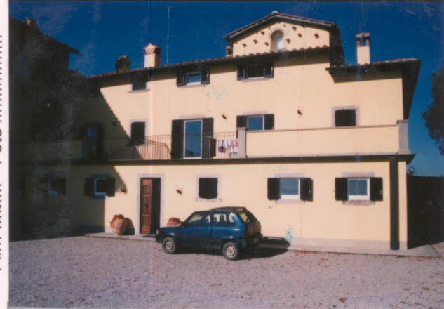
Film 684. Foto 1.....