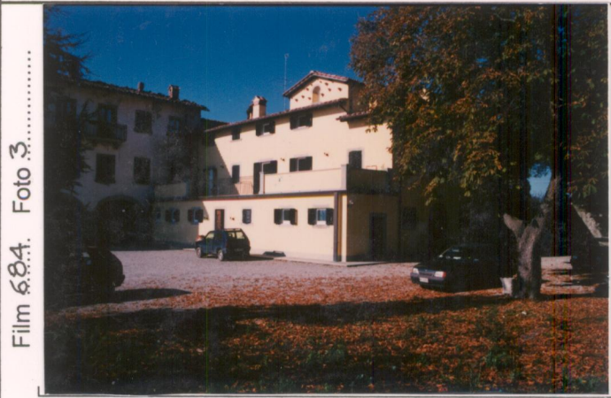
Film 684. Foto 3