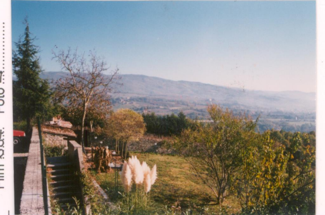
Film 684. Foto 4