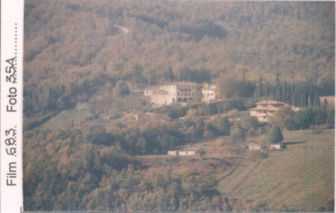
Film 683. Foto 55A.....