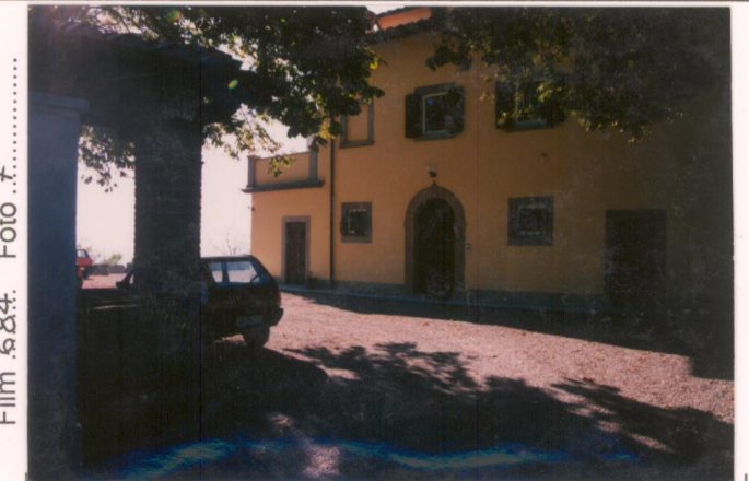
Film 684. Foto 7.....