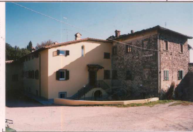
Film 684. Foto 6