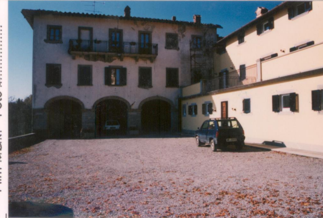
Film 684. Foto 2.....