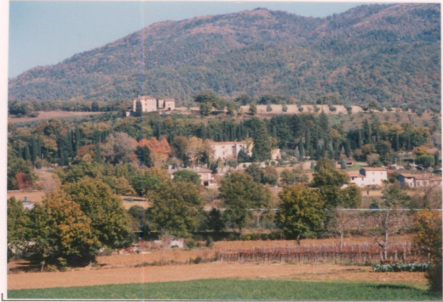
p.v. N. 2. Vista dalla strada per Cragnano.....