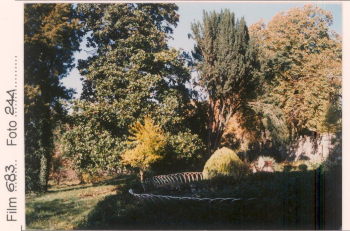
Film 683. Foto 24A.....