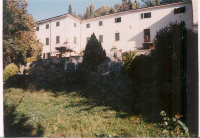
p.v. N. 5