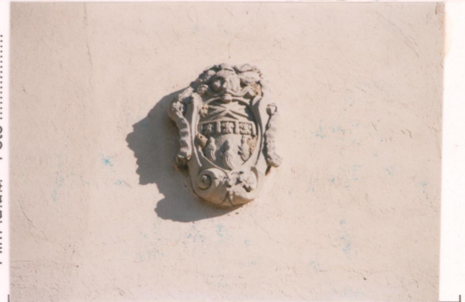
p.v. N. 4. Lo stemma sull'asse della facciata.....