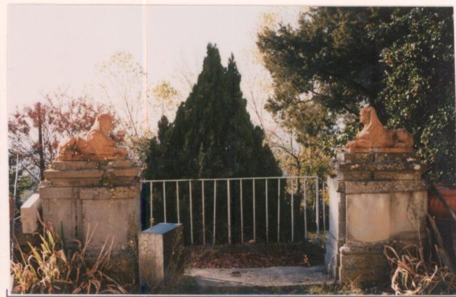
Film 683. Foto 32A.....