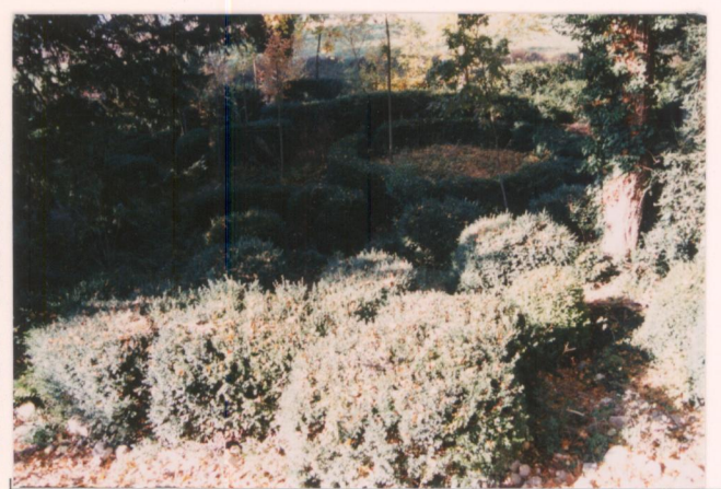
Film 683. Foto 30A.....