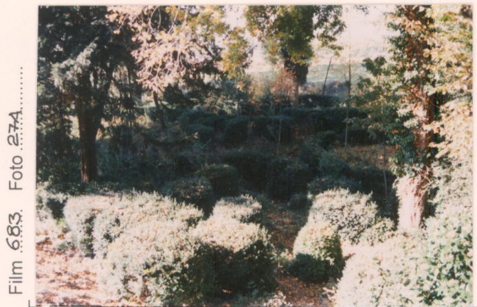
Film 683. Foto 27A.....