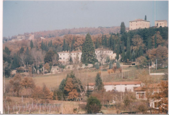
p.v. N. 1. Vista da Melelo.....