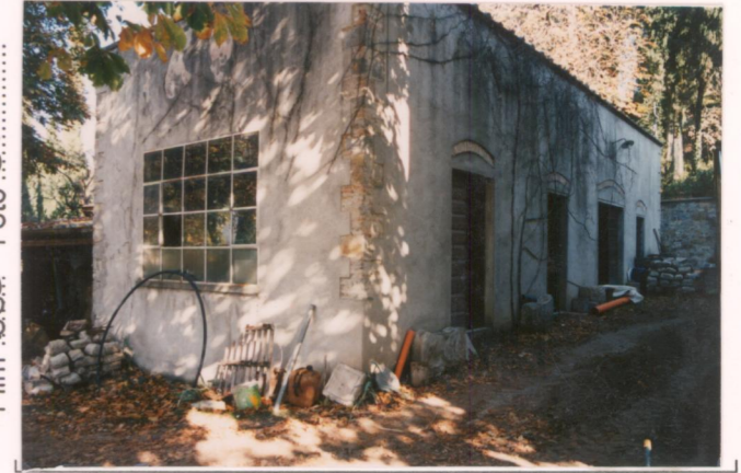
p.v. N. 8 La Limonaia