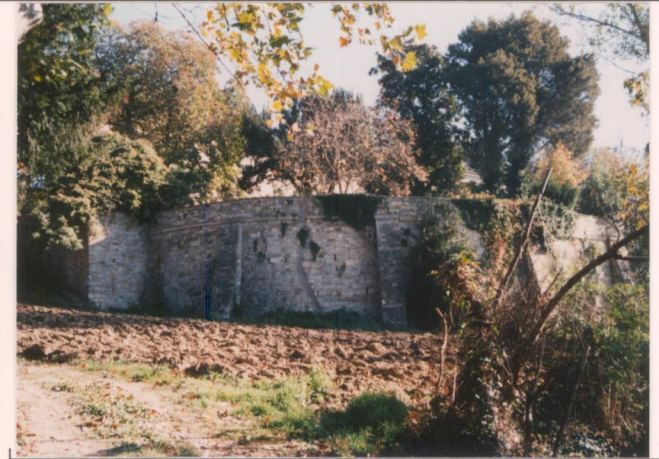
Film 683. Foto 28A.....