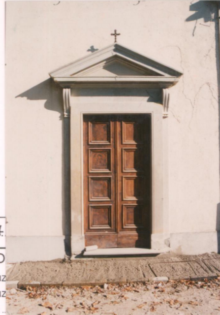
p.v. N. 7