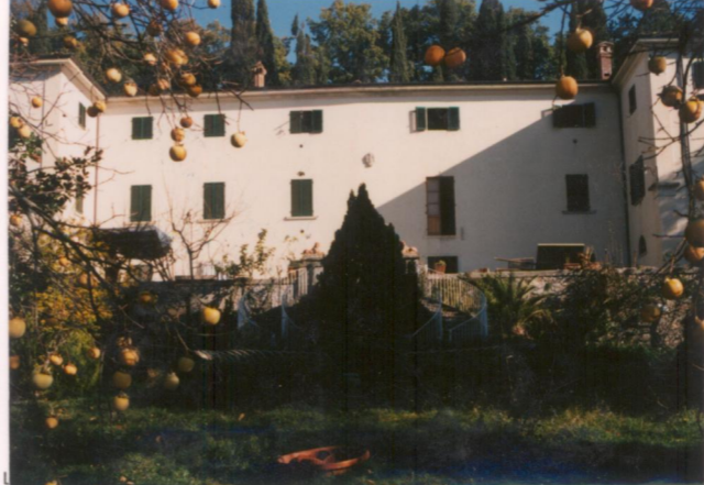
p.v. N. 3. Fronte sud-ovest.....