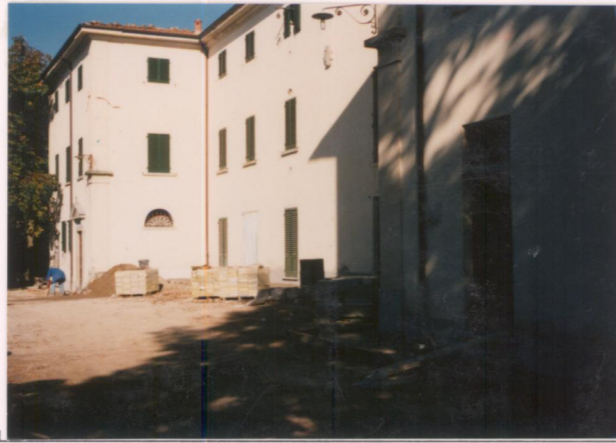
p.v. N. 6