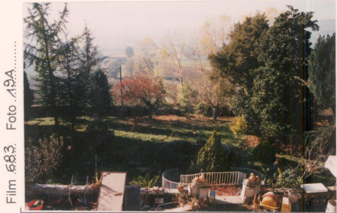
Film 683. Foto 19A.....