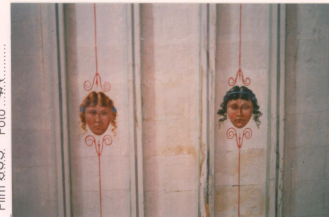
p.v. N. 12