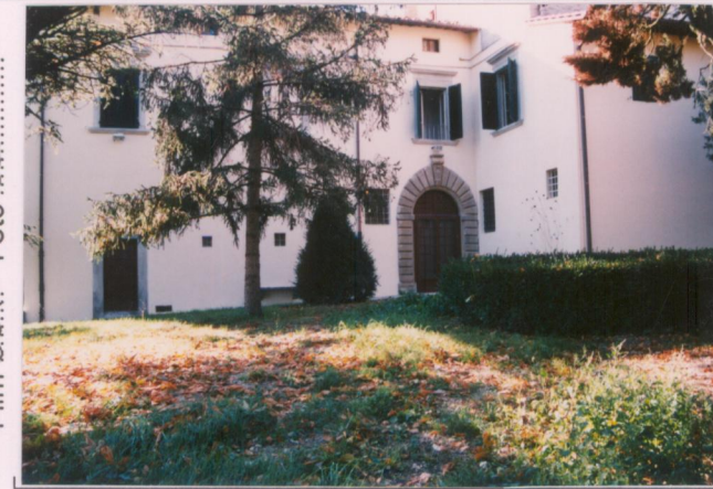
p.v. N. 3 Il fronte nord-est.....