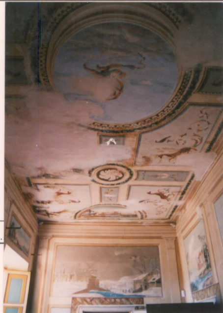
p.v. N. 10