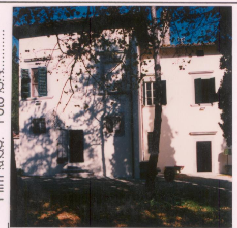
Film 695. Foto 6A