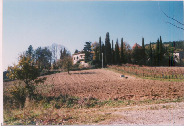
p.v. N. 1 Veduta dalla strada per C. Mancini.....