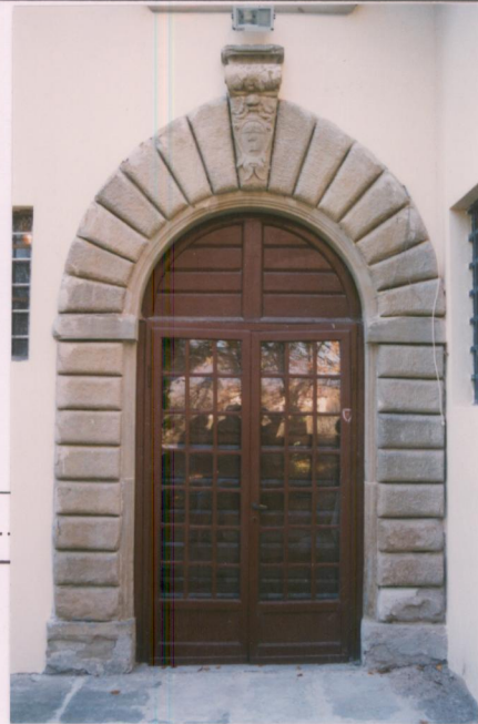
Il portale seicentesco