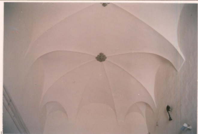
p.v. N. 9. Particolare di una delle volte interne