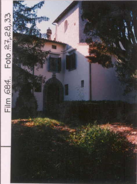
Film 684. Foto 27, 28, 33