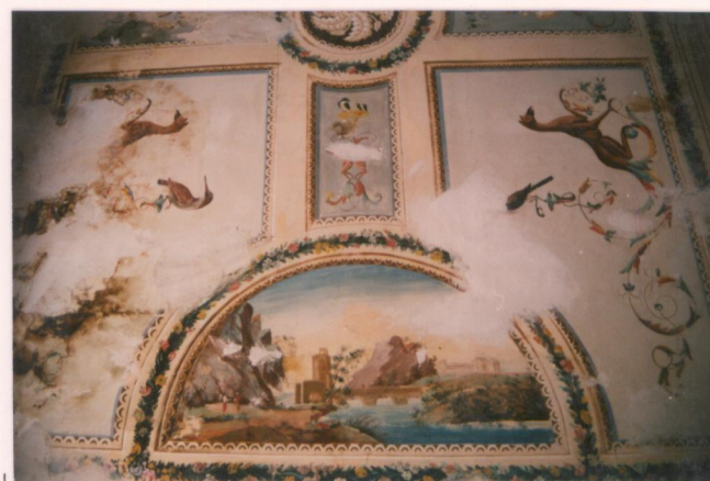
p.v. N. 11. Vedute e grottesche nelle stanze relative all'aggiunta settecentesca