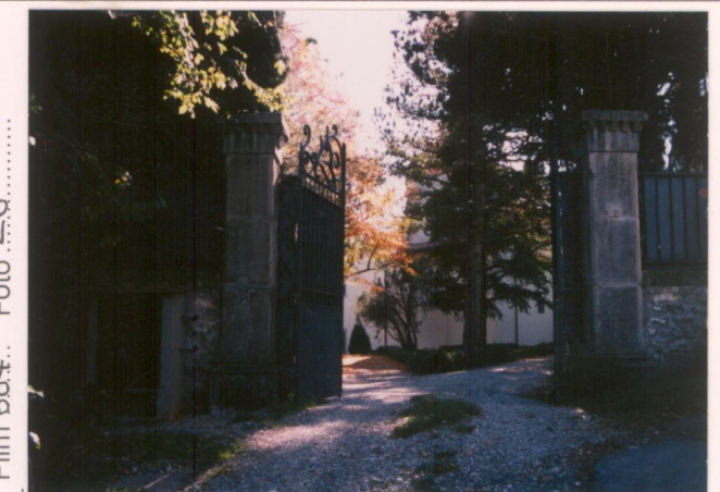
p.v. N. 18