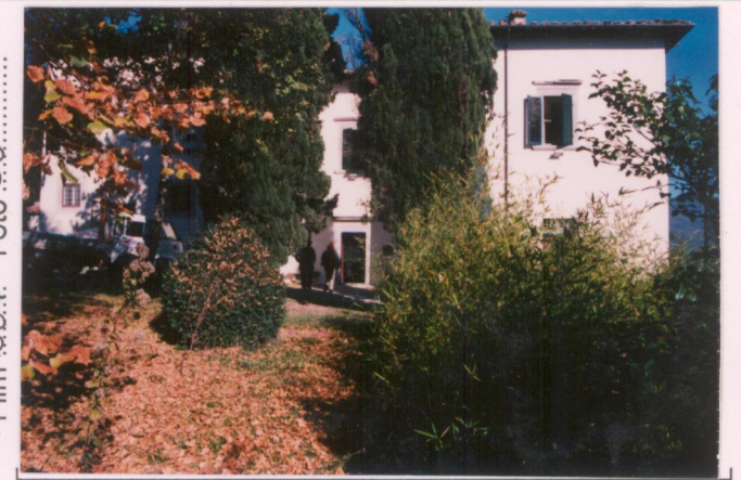
p.v. N. 4 Il fronte sud-ovest.....