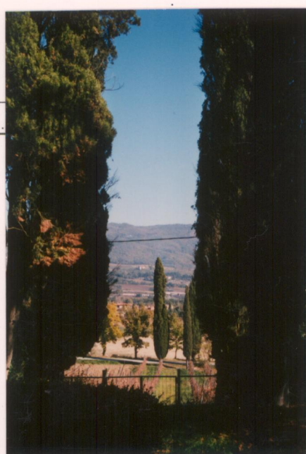
I cipressi forse residui di un precedente ingresso alla villa