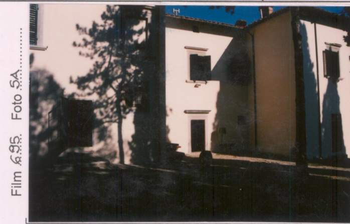
Film 695. Foto 5A