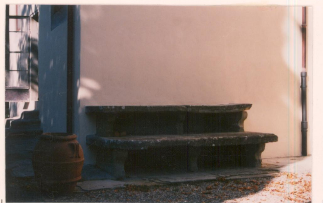
p.v. N. 13. Il portavasi in pietra