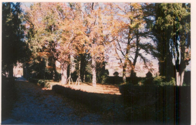
p.v. N. 14