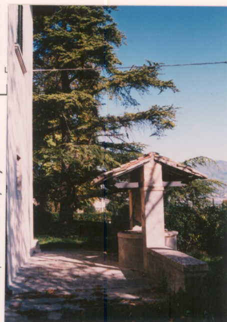
p.v. N. 15, 16, 17. Il pozzo