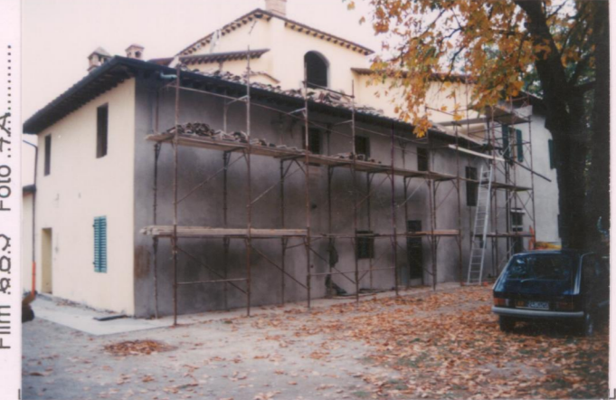
Film 6.8.3 Foto 7.A p.v. N. 4