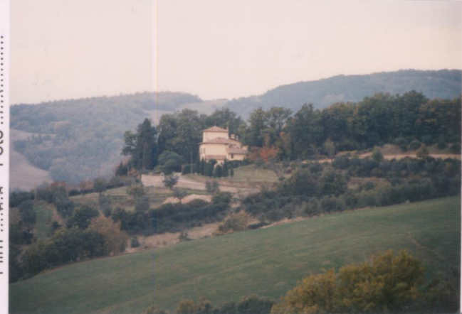
Film 6.8.3 Foto 1.A p.v. N. 2