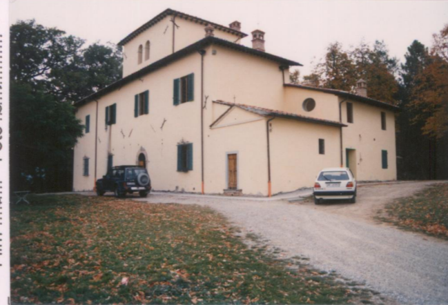
Film 6.8.3 Foto 6.A p.v. N. 3