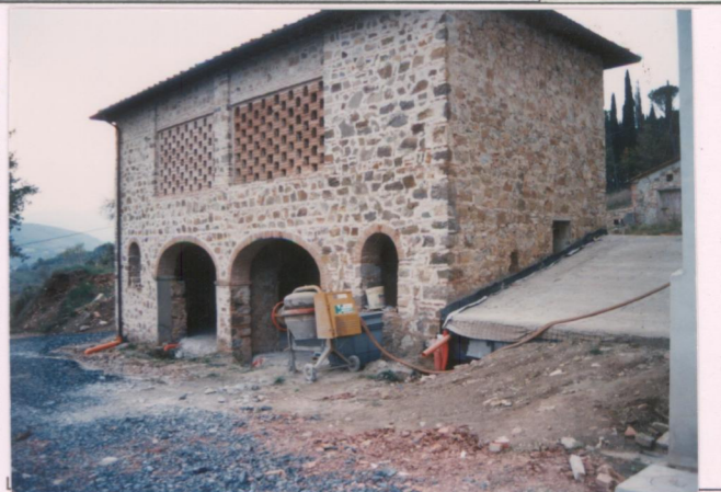
p.v. N. 4