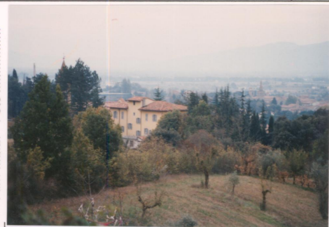
p.v. N. Fronte nord-est