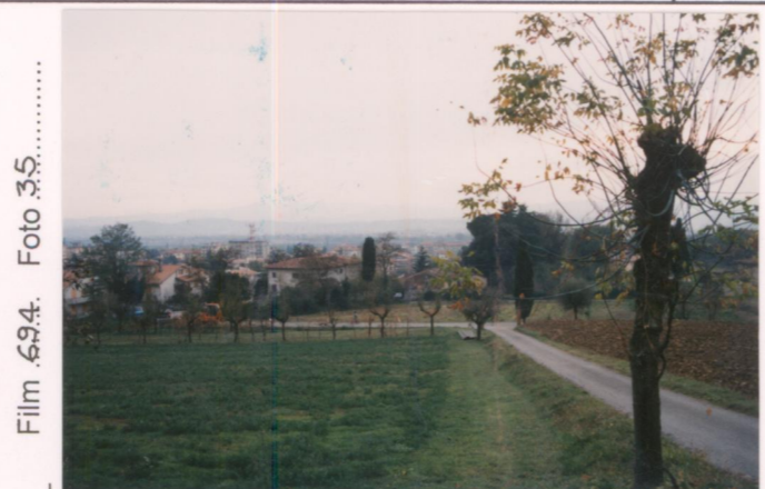
Film 634. Foto 35.