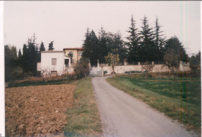
p.v. N. ....