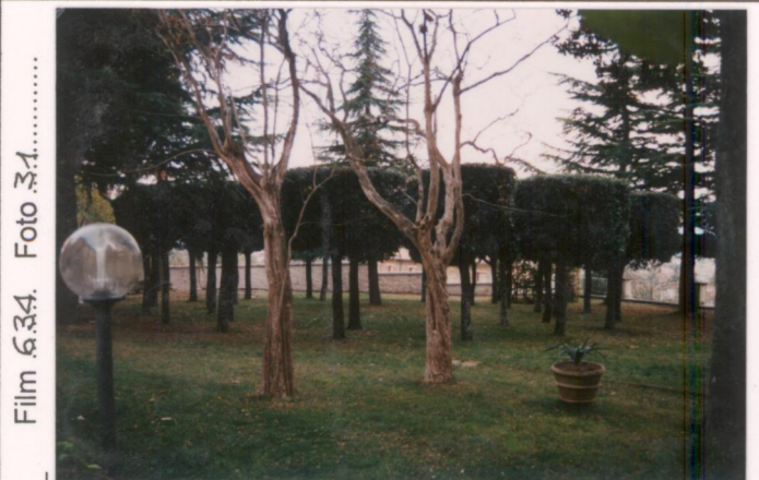
Film 634. Foto 31.