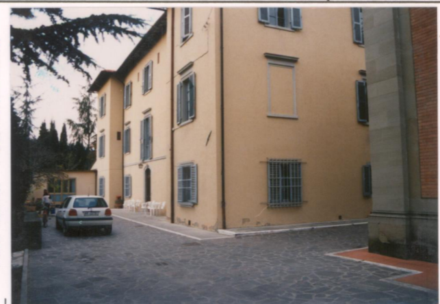
p.v. N. Fronte sud-ovest