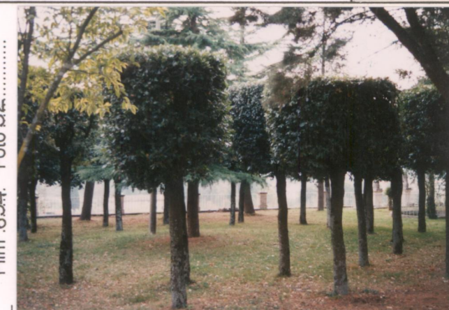
p.v. N. Particolare sistemazione dei lecci nel giardino antistante