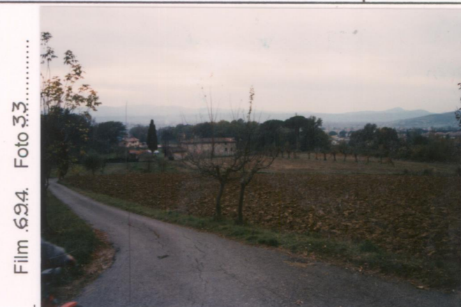
Film 624. Foto 33.