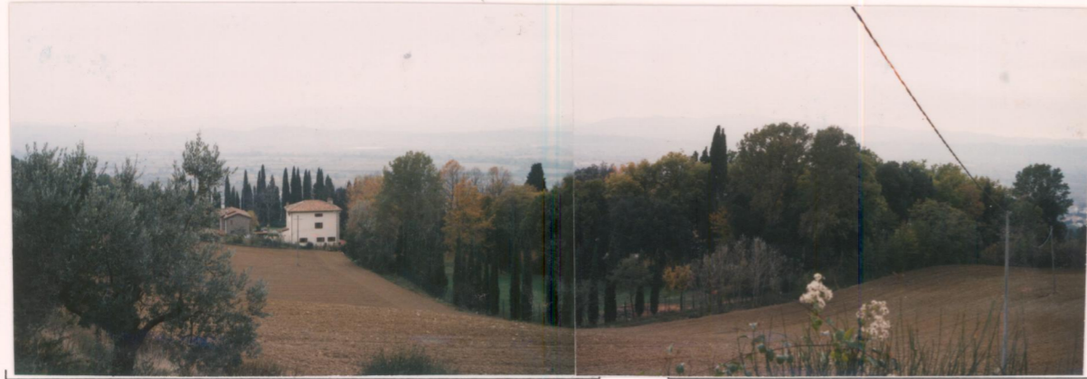
p.v. N. 5. Il bosco dietro la villa dall'alto.