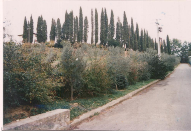
p.v. N. 7. Il viale d'accesso dalla strada sottostante la villa.