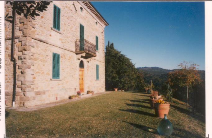
p.v. N. 4