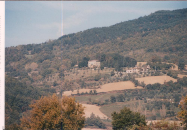
p.v. N. 2