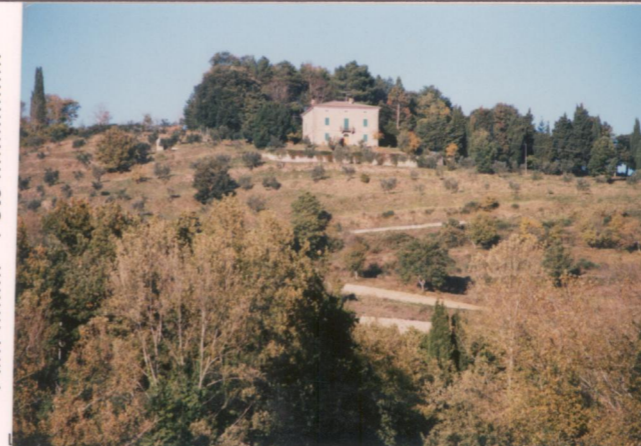
p.v. N. 3