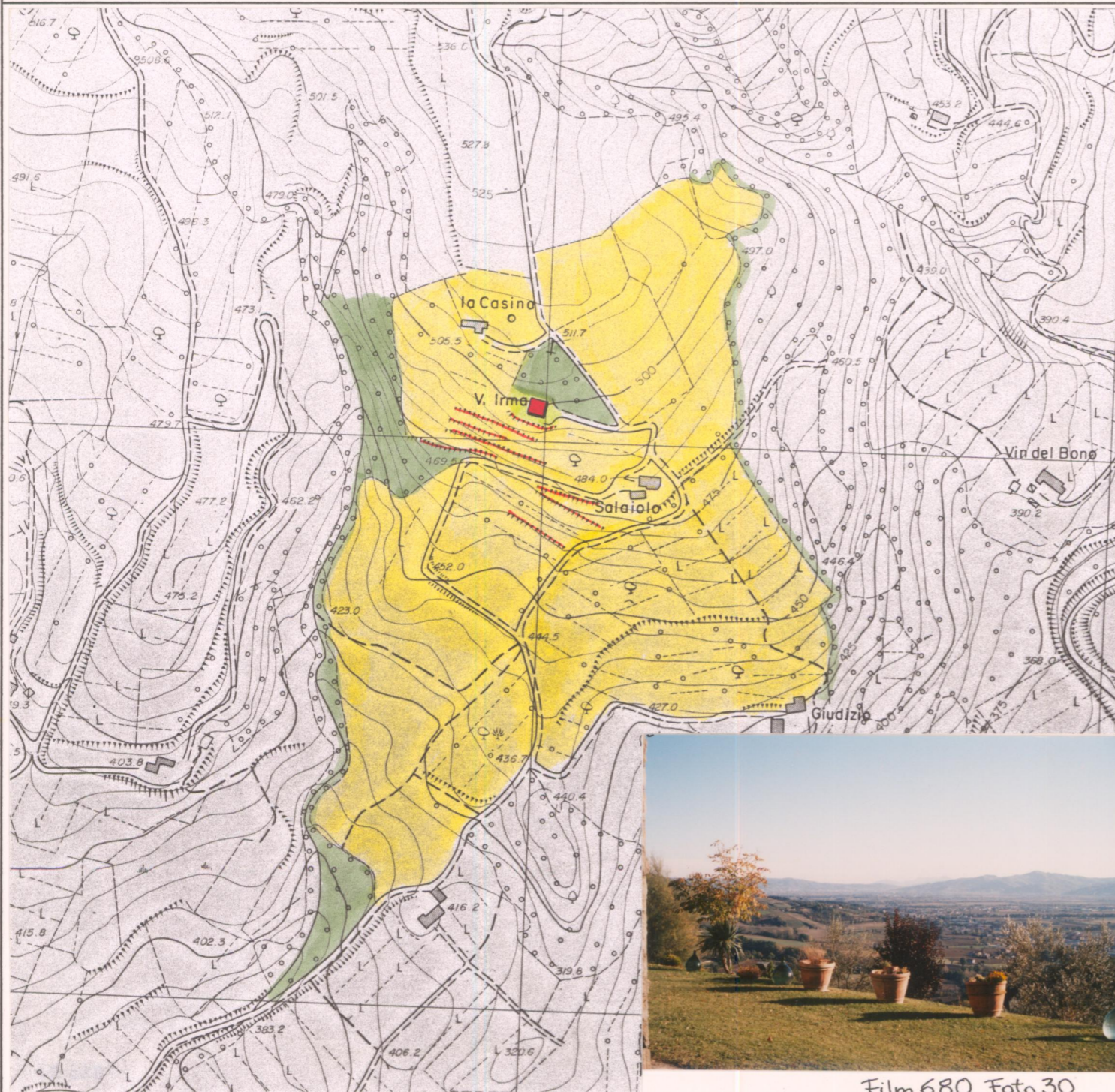
Film 680 Foto 30