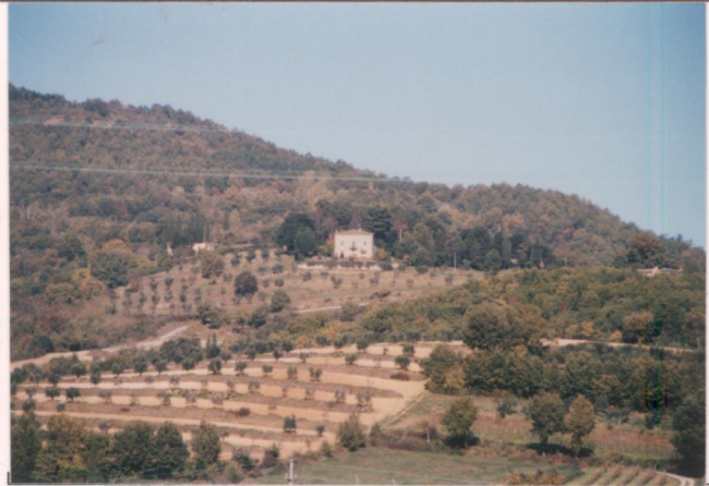
p.v. N. 1