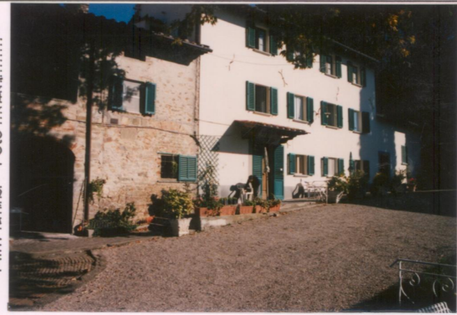
Film 679. Foto 13A.