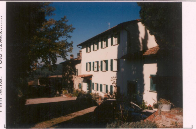
Film 679. Foto 15A.