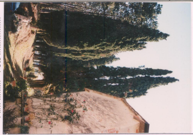
Film 679. Foto 15A.....