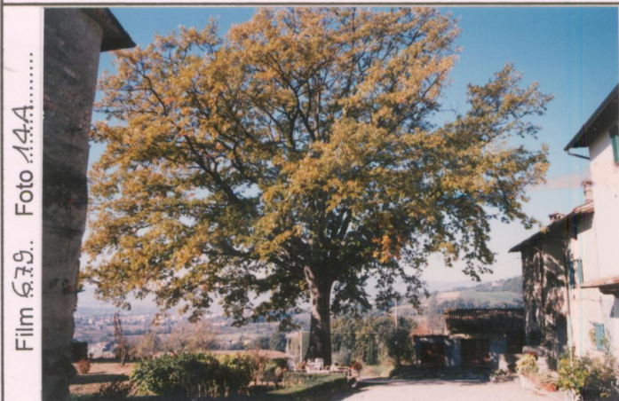
Film 679. Foto 14A.....