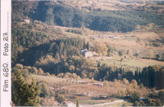
Film 68Q. Foto 27.