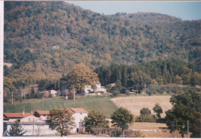
Film 68Q. Foto 11.