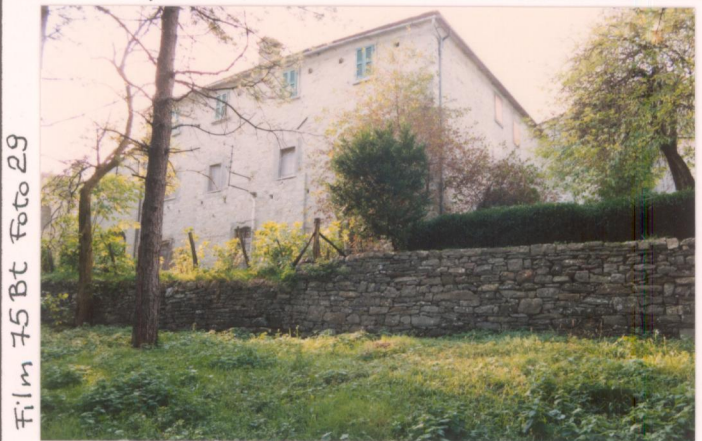
Film 75Bt Foto 29