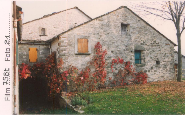
Film 75Bt Foto 24