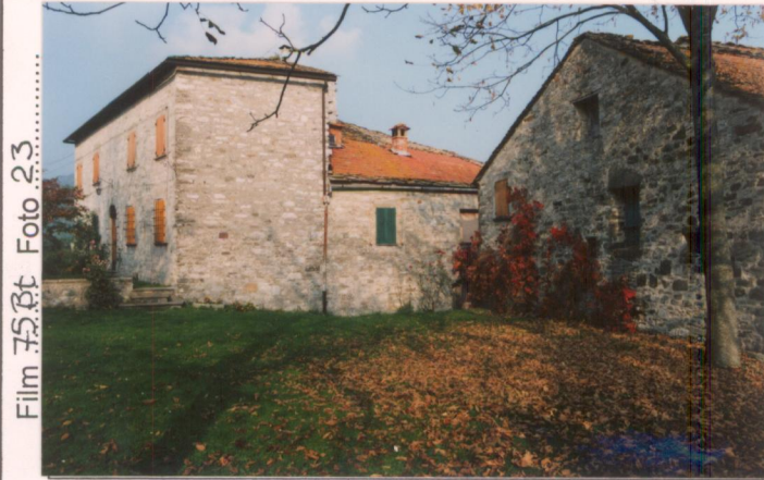
Film 75Bt Foto 23