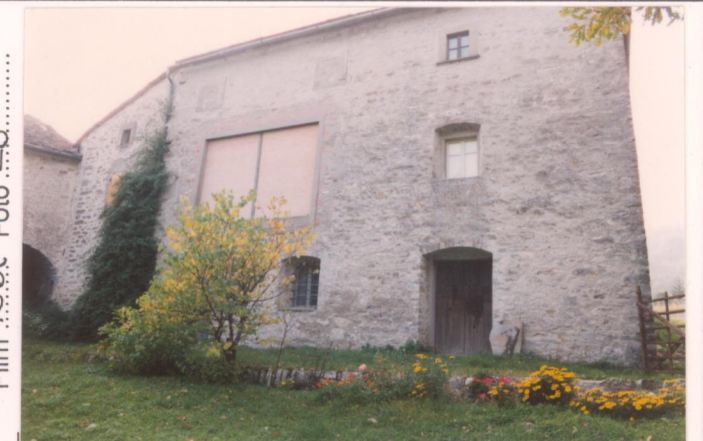
Film 75Bt Foto 28