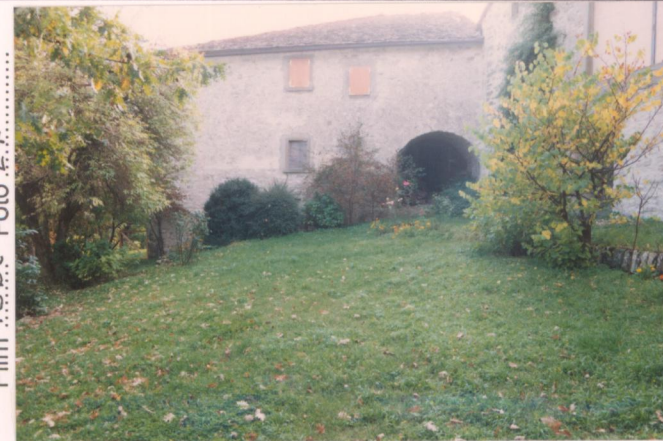
Film 75Bt Foto 27