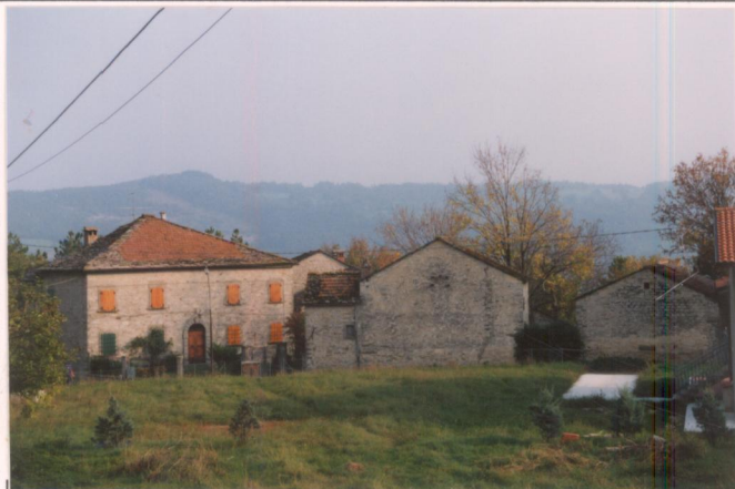
p.v. N. 1 Vista dalla chiesa