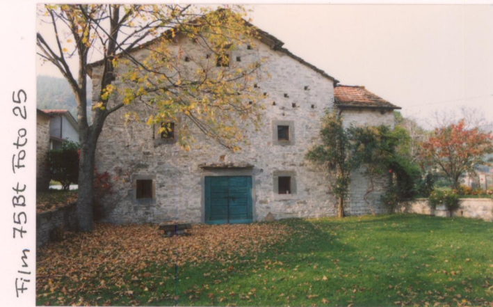
Film 75Bt Foto 25