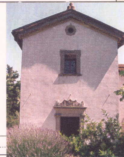
Film 7.60. Foto 2.4. p.v. N. 4.