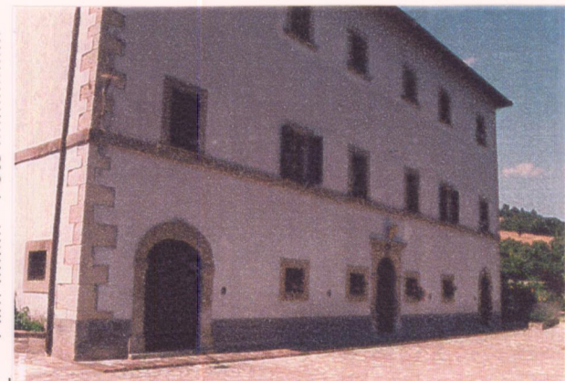
Film 7.60. Foto 2.0. p.v. N. 2. Il fronte principale della villa verso sud-est