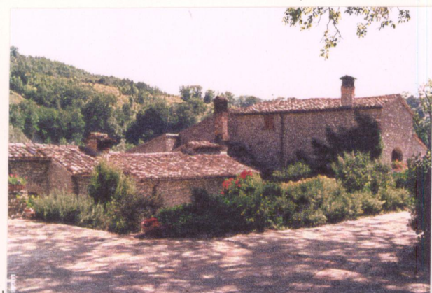
p.v. N. 5... Il mulino preesistente alla villa