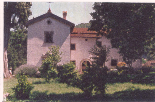
Film 7.60. Foto 2.1. p.v. N. 3. Il fronte nord-ovest con la cappella