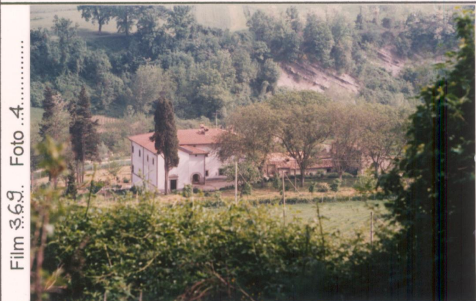
Film 3.69. Foto 4. p.v. N. 1. Vista da Monterone