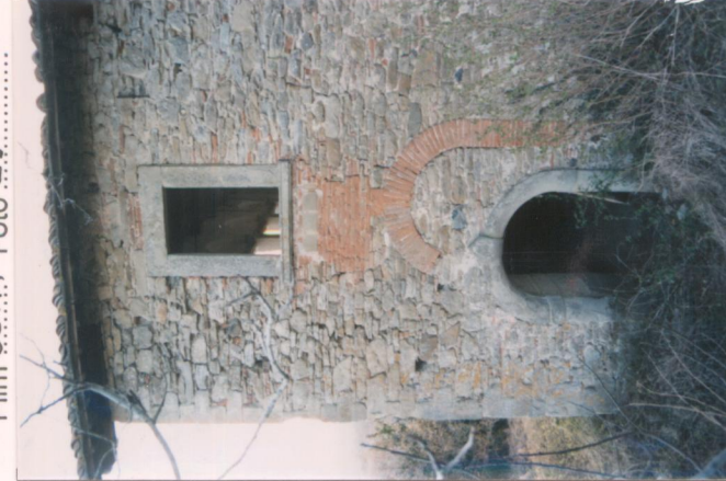
Film 35An Foto 29