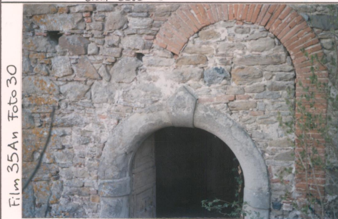
Film 35An Foto 30