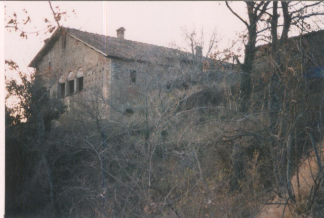
p.v. N. 2. Fronte sud e est.....