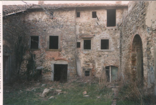
p.v. N. 3. Fronte est.....