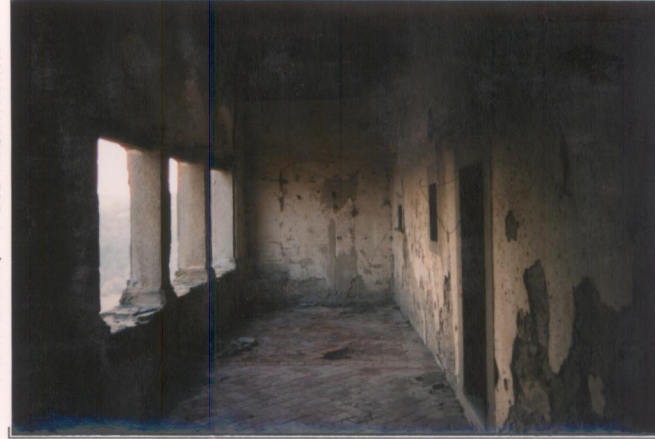
Film 35An Foto 23