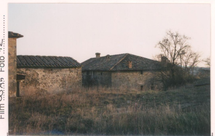
Film 35An Foto 12