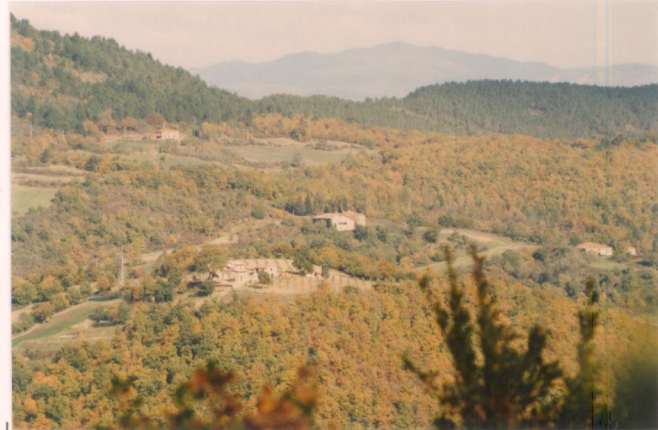
p.v. N. 1. vista da Gello.....