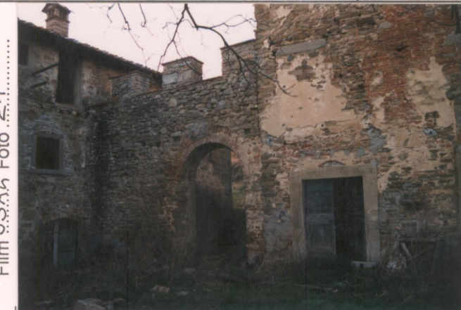
p.v. N. 4. La porta di accesso alla corte interna.....