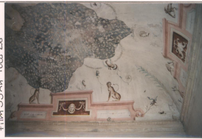
Film 35An Foto 26