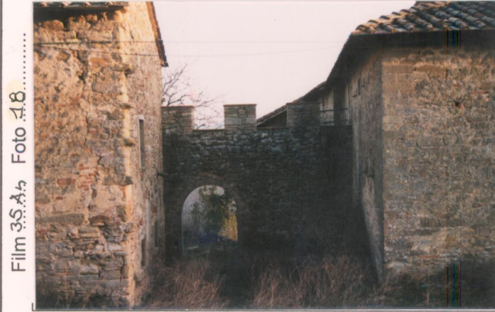
Film 35An Foto 18